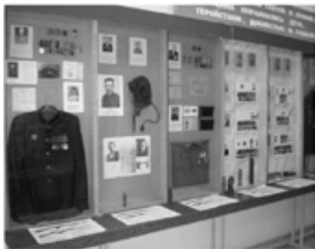
Экспозиция муниципального музея в Большом Игнатове

Мемориальные музеи существуют при поддержке властей, меценатов, инициативных групп. В 2005 году в селе Сургодь Торбеевского района торжественно открылся музей татарского поэта Хади Такташа. Инициаторы и организаторы смогли заинтересовать в проекте влиятельных и именитых личностей, что решило проблемы с финансированием.