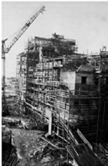
Строительство Марийского целлюлозно-бумажного комбината

Дальнейший рост посёлка связан со строительством другого предприятия – Марийского целлюлозно-бумажного комбината. Возведение комбината было объявлено Всесоюзной ударной стройкой. Он являлся крупнейшим не только в нашей стране, но и в Европе. Его строительство должно было решить проблему производства технических видов бумаги, которые полностью приходилось закупать за рубежом. «Богатырь на Волге», «Ма-