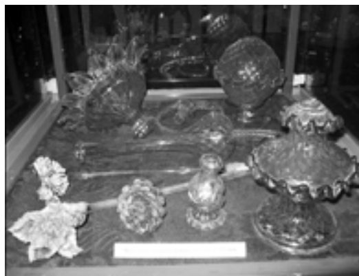
Фрагменты шикарной люстры венецианской стекла

Сохранились фрагменты некогда шикарной люстры венецианского стекла, освещавшей первоначально при помощи свеч, а затем и электричества, картинную галерею замка. Цветовое решение люстры состоит из белого, красного и синего оттенков,