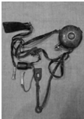
Портупей охотничья в комплекте

В достаточном количестве представлены предметы вспомогательного снаряжения к огнестрельному оружию. К таковым относятся ремни-портупей («тасма», «кыйсян завод») с набором принадлежностей – пороховница, кожаные и холщевые мешочки-кисеты для хранения дроби, кремня, трута и капсюлей (пистонов). Всего имеется 22 портупей в комплекте, роговых и деревянных пороховниц в отдельности – 13 ед.хр., отдельных элементов набора – 5 ед.хр., патронташи и ягдташ (охотничья сумка). Пороховницы представлены 3-мя видами: 1) в виде круглого фляжкообразного закрытого сосуда, выполненного из капа, иногда декорированного линейно-круговой и трехгранно-выемчатой резьбой или окрашенного; 2) роговые пороховницы-натруски в виде изогнутого конуса, уплощенные, орнаментированные; 3) роговые натруски круглые.