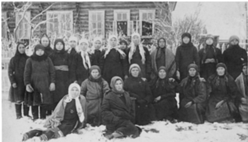
Женделегатки Мари-Солинского района, Сернурского кантона. 7 ноября 1929 г.

В апреле 1927 года при Президиуме Маробисполкома орга-