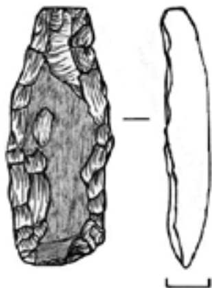
Рис. 4. Тесло из окремненого известняка. Майданское IV поселение. Сборы 2011 г.

Судя по материалам, полученным при обследовании памятников археологии в 2011 г., энеолитические поселения Волго-Ветлужского междуречья по-прежнему находятся в сложной гидротопографической ситуации. Тревожит дальнейшая судьба древних артефактов из подтопленных Чебоксарским водохранилищем поселений меднокаменного века. Подъемный материал из гибнущего культурного слоя необходимо фиксировать и накапливать, вводить в научный оборот.