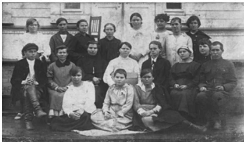
I-й областной съезд дошкольных работниц

Работа детских учреждений в то непростое время только еще