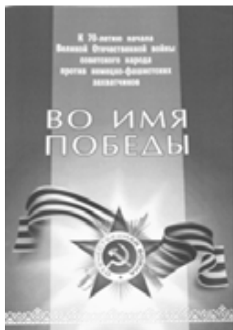
Сборник «Во имя Победы»