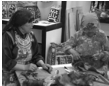
Семинар-практикум «Технология изготовления меховых изделий». 2011 г.

На выбор темы семинара влияет то, насколько сохранен тот или иной вид ремесла. Например, технология изготовления меховых изделий. На казымской территории многие представители народа ханты ведут традиционный образ жизни. Соответственно потребность в меховых изделиях сохранилась. В то же время в искусстве меховой мозаики протекают новые веяния. В орнаментике появляются новые символы и знаки. Иногда они достаточно органично вливаются в традиционную систему узоров. Но иногда стремление к обновлению образного языка меховой мозаики приводит к внедрению в нее чуждых мотивов. Ситуация усугубляется тем, что появление моды на этнографию породило огромное количество различных изделий, выдаваемых за традиционные, но не соответствующих канонам. Получить необходимую оценку такого рода «инновациям» у жителей из глубинки нет возможности.