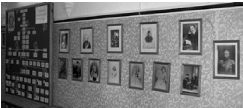
Подлинные фотографии семьи помещиков Шереметевых

Замок Шереметевых – памятник архитектуры конца XIX-начала XX вв. является интереснейшим образцом усадебного зодчества. В этом году исполнилось 200 лет с момента покупки Шереметевыми села Юрино.