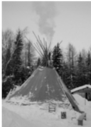
Зимний чум Музей с. Казым.

Всё это дало возможность создать сеть этнографических музеев на территориях проживания локальных групп обских угров. На всех уровнях стало понятно, что традиционная культура коренных этносов оказалась слишком хрупкой и без серьезной поддержки со стороны государства она неспособна выдержать