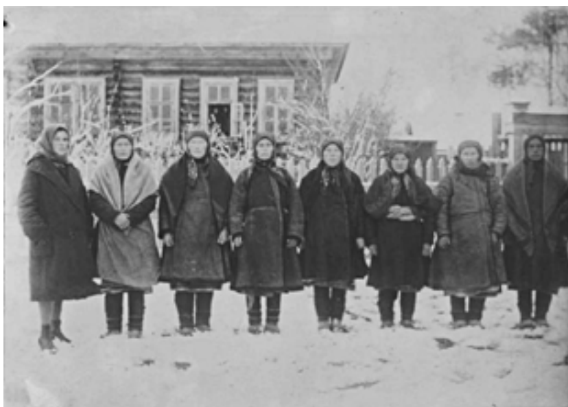
Праздничный день снятия шымакшей. Мари-Солинский район, Сернурский кантон. 1929 г.

города. Большое внимание уделяется условиям работы женщин на лесозаготовках. Из протокола заседания комиссии: «Жилищно-бытовые условия для женской рабсилы в лесу не созданы, бараки не приспособлены для женщин, ... имеется утечка рабсилы с лесозаготовок, тем, кто работает по 5-6 месяцев, нужно дать необходимую одежду...» [16]. Также усилилась работа по привлечению женских национальных кадров во все сферы производ-