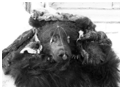
Главный атрибут праздника Медвежьи Танцы

Медвежьи Танцы ежедневно посещали более ста человек, из них около 40 детей разного возраста. Всего записано 85 песен и сенок, сделано 1850 фотографий, видеозаписи на 17 часов. Чувствовалось объединение хантыйской общности, люди приходили целыми семьями в красивых национальных нарядах, рядом со взрослыми