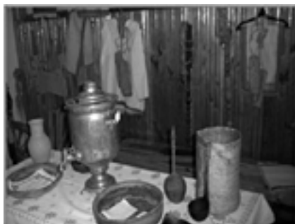
Фрагмент выставки школьного музея

ребенку как можно больший багаж знаний, сколько обеспечить его общекультурное, личностное и познавательное развитие, вооружить таким важным умением, как умение учиться. В основе данного стандарта лежит системно-деятельностный подход. Принцип деятельности заключается в том, что формирование личности ученика и