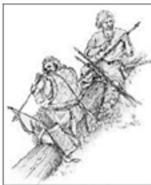
Марийцы славятся своими лучниками

В Украине немало населенных пунктов под названиями: Черемысы, Черемпиль, Черемисы, Чемеровцы, а также фамилий: Чемерис, Чимерис, Черемис, Чемерисенко... названия которых ученые связывают с марийцами. Предки украинцев, которые имеют такие фамилии скорее всего происходят из марийцев – народа который во время Ивана Грозного, а позже Богдана Хмельницкого славился не только свободолобием и отвагой, но и особым военным мастерством. Марийские лучники считались тогда лучшими в восточной Европе.