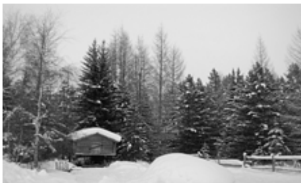
Лобаз в этнографическом музее с. Казым.

альной и духовной культуры: казымских хантов и лесных ненцев. Естественная среда обитания этих этнических групп всё более и более размывается. В Белоярском районе уже начинается освоение нефтя-