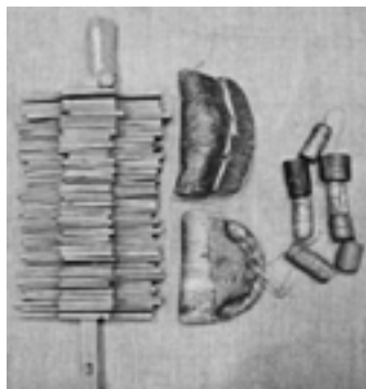
Поплавки деревянные для сети, грузила каменные для сети, поплавки берестяные