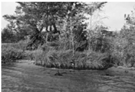
Рис. 3. Майданское IV поселение (юго-западная часть памятника). 2011 г.

В южной, размытой водохранилищем, части памятника обнаружены остатки древней материальной культуры. Основной материал собран на отмели. Коллекция артефактов состоит из фрагмента верхней части керамического сосуда воло-