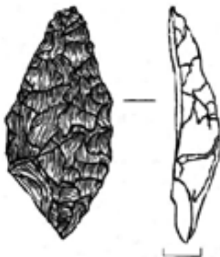
Рис. 2. Нож листовидной формы на кремневом отщепе. Сутырское V поселение. Сборы 2011 г.

Майданское IV поселение, разрушенное в период сооружения оградительной дамбы, в настоящее время подтоплено Чебокс