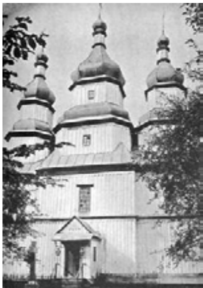
Церковь в с. Черемисы Барские. XVIII в.

Борьба мариЙцев за независимость от Москвы стала причиной многочисленной эмиграции этого народа в Украину. Немецкий путешественник Сигизмунд Герберштейн в своих «Записки о Московии» рассказывает, что в 1527 году Московский государь переселил пленных мариЙцев на западные границы своего государства. Но значительная часть пленных бежала через Беларусь на Волынь [2:164]. МариЙский историк Сергей Свечников нашел