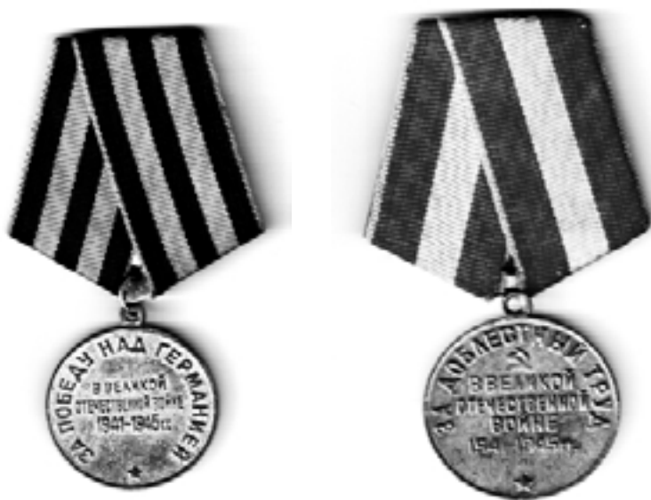
Медали «За Победу в Великой Отечественной войне 1941-1945 гг.» и «За доблестный труд в Великой Отечественной войне 1941-1945 гг.»