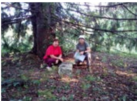
Обследование памятников в Моркинском районе в 2021 г. ОКН «Ердурское кладбище»