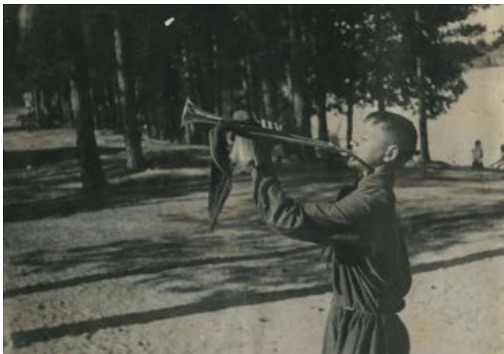
Горнист пионерского лагеря «Таир» дает сигнал подъема. 1930-е гг.