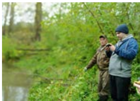
Обследование памятников в Горномарийском районе в 2022 г. ОКН «Юнгакушергинская стоянка»