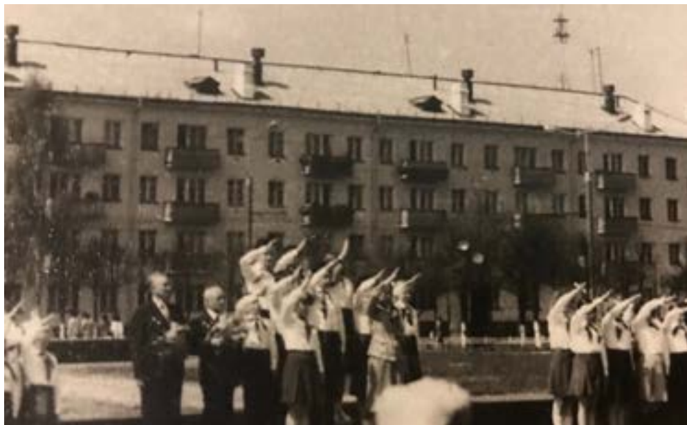
Почетный караул. 1985 г.

В 1980-х годах пионеры городских школ поочередно принимали участие в Почетном карауле у Вечного огня, неся вахту памяти жертв Великой Отечественной войны. В Почетном карауле имели честь участвовать только достойные пионеры, первые в учебе и активные в пионерских делах.