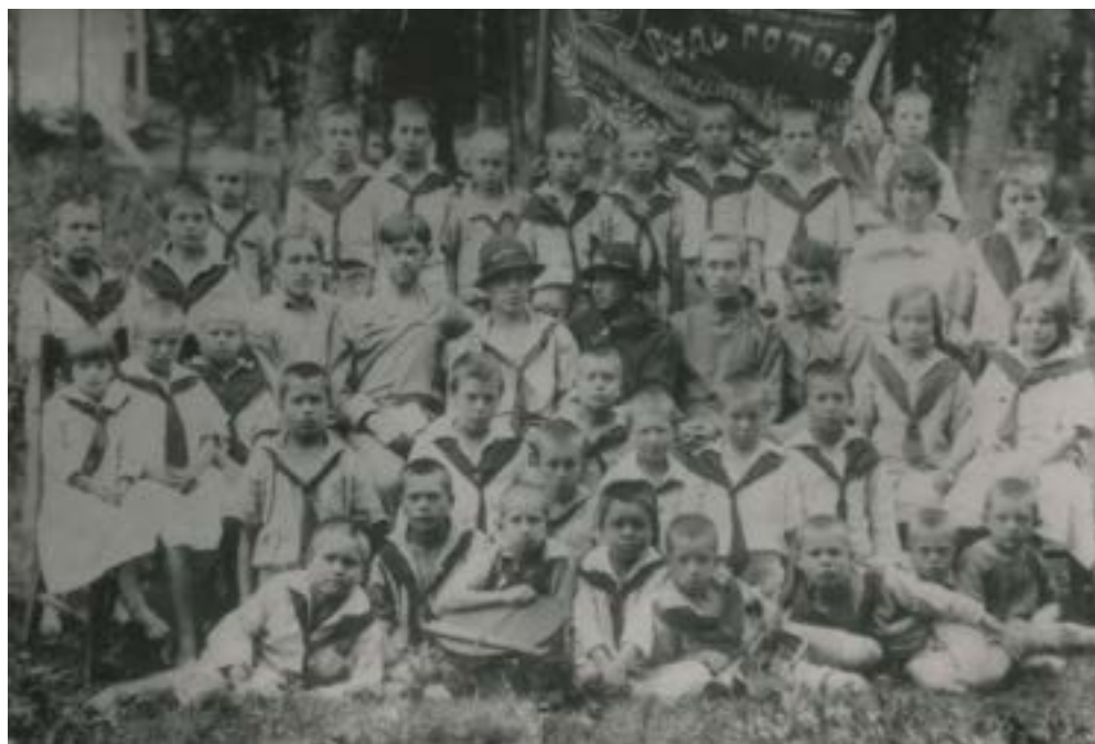
Первый марийский пионерский отряд. 1924 г.