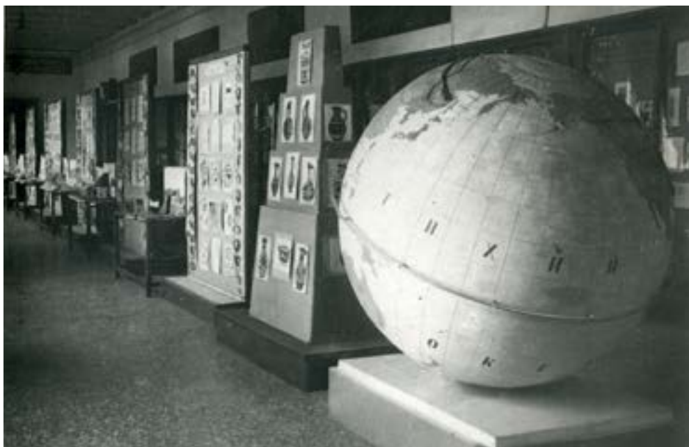
Выставка работ школьников-кружковцев в комнате школьника. 1937 г.

Государственный музей этнографии предпринимал попытки расширить детскую аудиторию и выйти за пределы г. Ленинграда. Так, в 1939 г. в деревню Изино Ярославской области по запросу были высланы фотографии быта народов СССР для школьного пионерского уголка [6, л. 3]. Они были отправлены вместе с предложением по организации «заочного» этнографического кружка [11, л. 15]. Однако история не получила продолжения.