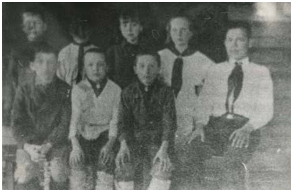
Пионеры Большепаратской школы Волжского района. 1930-е гг.

Однако пионерское движение постепенно стало распространяться по всей Марийской автономной области.