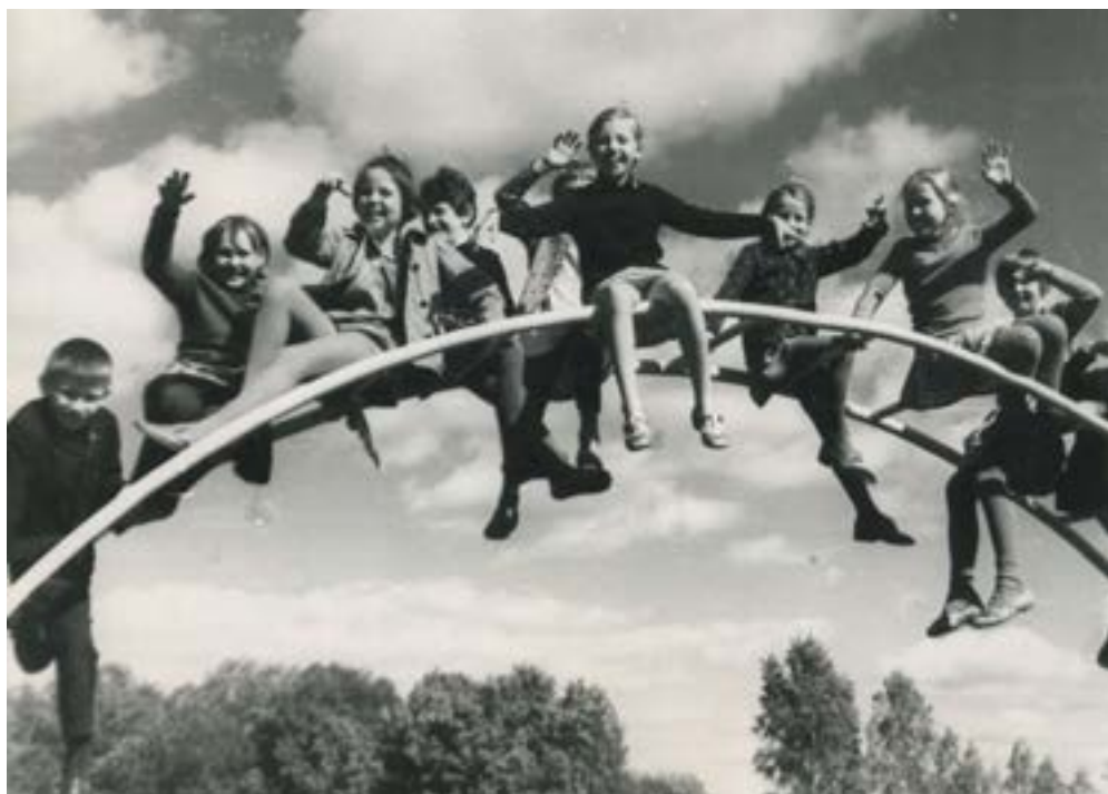
Пионерский лагерь «Звездочка». 1972 г.