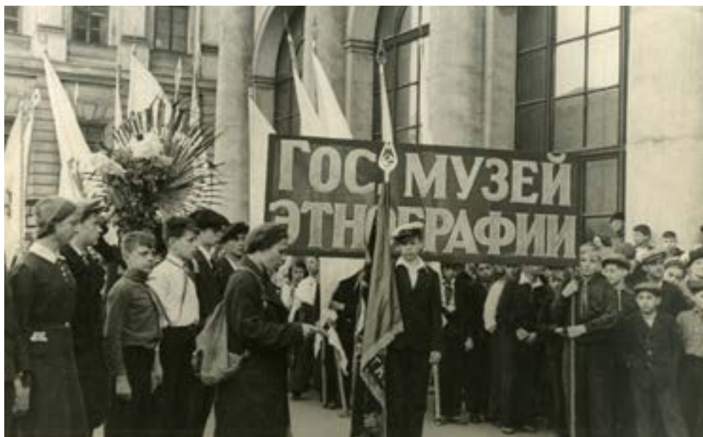
Колонна школьников Государственного музея этнографии на Параде музеев. 1939 г.

В представлении от музея участвовало 80 школьников-кружковцев.