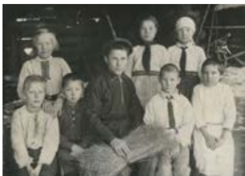
Пионеры колхоза «Пеледыш» («Цветок»). 1936 г.