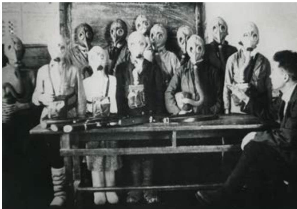
Занятия по военному делу. 1941–1945 гг.