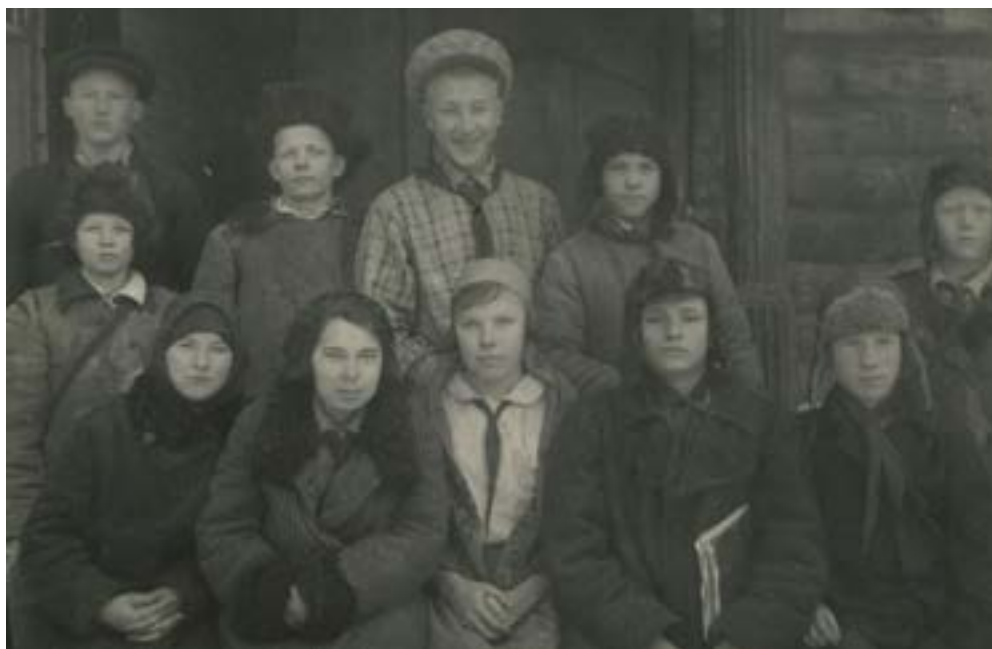
Совет Оршанского пионерского отряда. 1933–1934 гг.