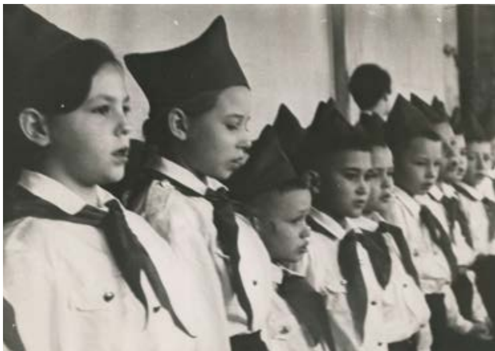
Пионеры в Марийском научно-краеведческом музее. г. Йошкар-Ола. 1967 г.