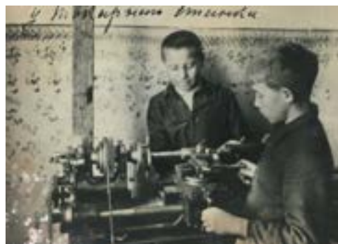
У токарного станка