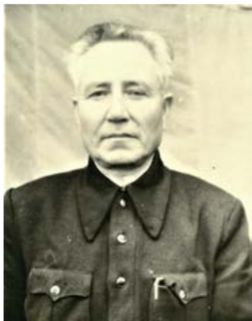
С. Х. Патрушев. 1960 г.