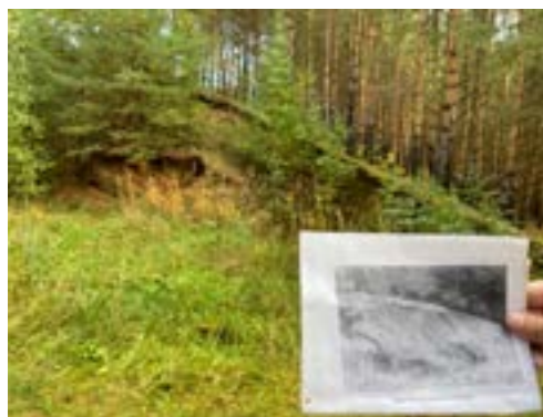
Обследование ОКН «Кукшелидское кладбище» в Горномарийском районе в 2022 г.: фотография памятника 2005 г. и его современное состояние

У других участников экспедиции получается лучше наладить контакт с местным населением. И в процессе неформального общения местные жители сообщают сведения о памятнике: где его можно найти, как до него добраться, как памятник называют сами местные жители.