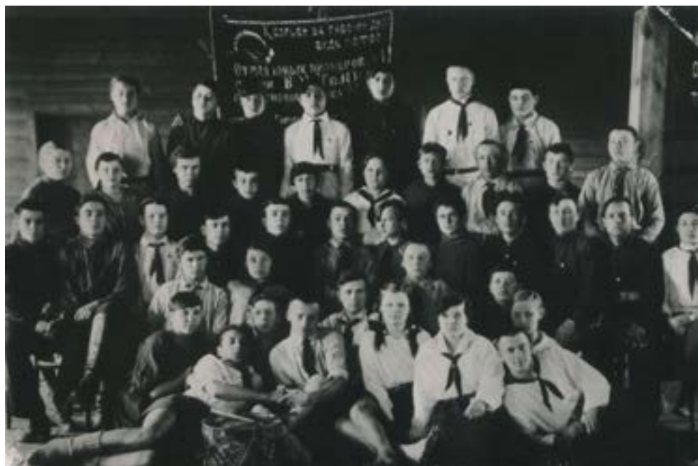
Областные курсы детдвижения в Краснококшайске. 1925 г.

На следующей фотографии мы видим участников первых Областных курсов детдвижения, которые проходили в Краснококшайске с 26 марта по 2 мая 1925 года.