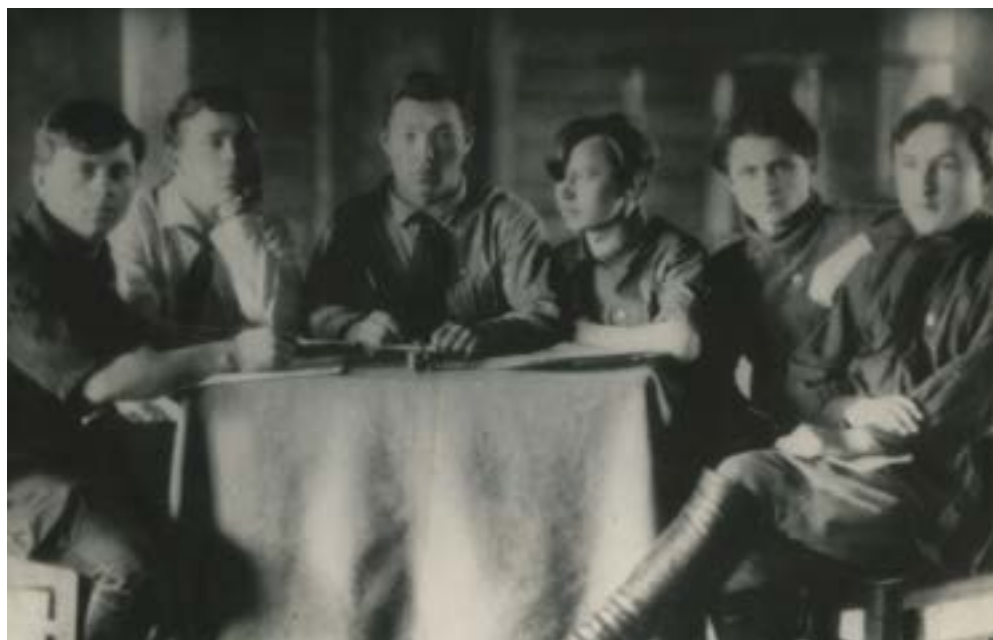
Президиум областных курсов пионерработников. 20 мая 1925 г.

На следующей фотографии мы видим участников первых Областных курсов детдвижения, которые проходили в Краснококшайске с 26 марта по 2 мая 1925 года.