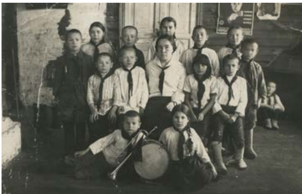
Ударники-пионеры по учебе образцового отряда Параньгинского района. Нач. 1930-х гг.

В июле 1932 года проходил Первый областной слет ударников учебы, на фотографии запечатлены марийские ребята, лучшие в учебе и активные в пионерских делах.