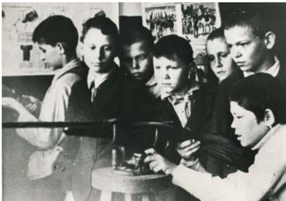
Занятия по военному делу. 1941–1945 гг.