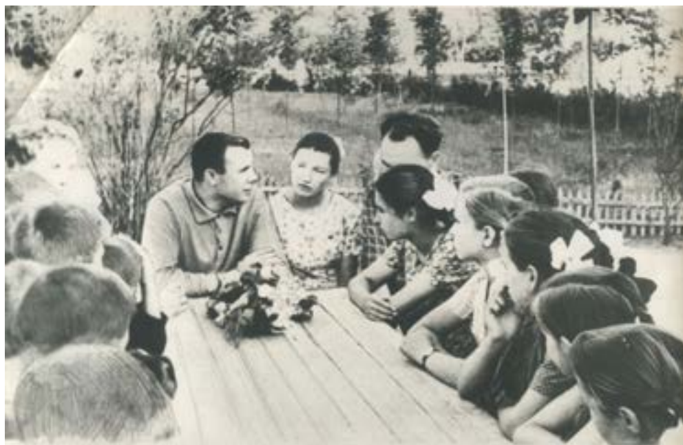
Встреча марийских пионеров с Юрием Гагариным. Июнь 1964 г.

ребят об их делах, жизни в интернате, о том, кем они хотят стать, рассказывал и о себе, о том, как стать космонавтом: много трудиться, заниматься спортом, быть организованным. В дружеской беседе незаметно пролетел час. Переписка с Юрием Алексеевичем длилась еще 3 года, до того момента, как дети разошлись из интерната по разным учебным заведениям. После той короткой встречи Гагарин запомнил имена некоторых из ребят и в письмах искренне интересовался их судьбой [3].