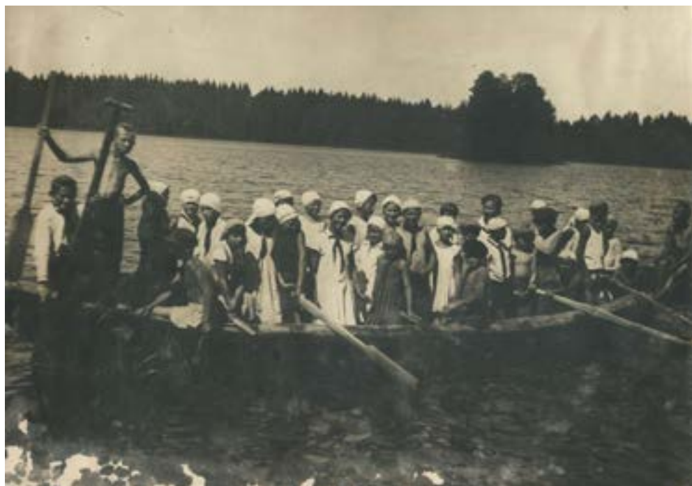
В пионерском лагере «Таир». 1930-е гг.