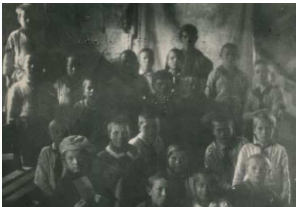
Первое звено Краснококшайского пионерского отряда. 1924 г.