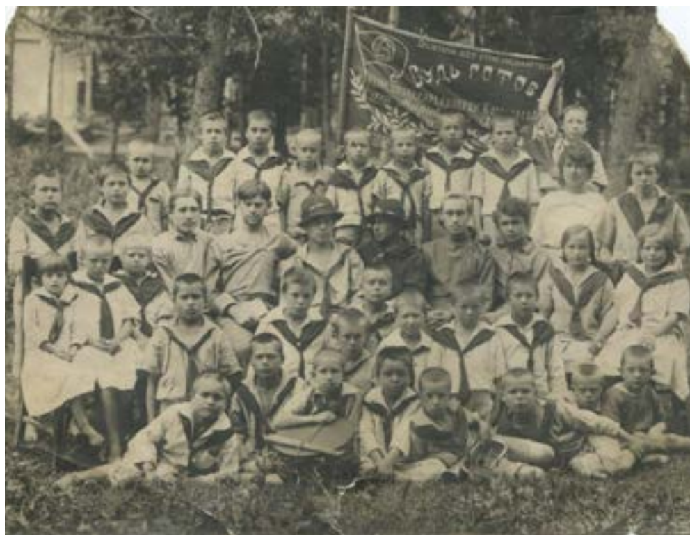
Первый пионерский отряд г. Краснококшайска. Июль 1923 г.