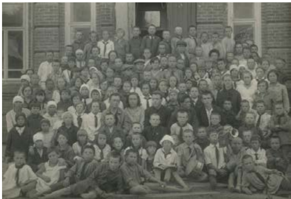
Первый Областной слет ударников учёбы. 1932 г.