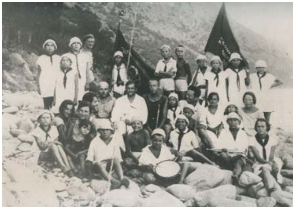
Артек. Марийская группа. 7 июля 1927 г.