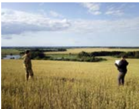
Обследование памятников в Волжском районе в 2021 г. В «поисках» ОКН «Чодраяльская стоянка»