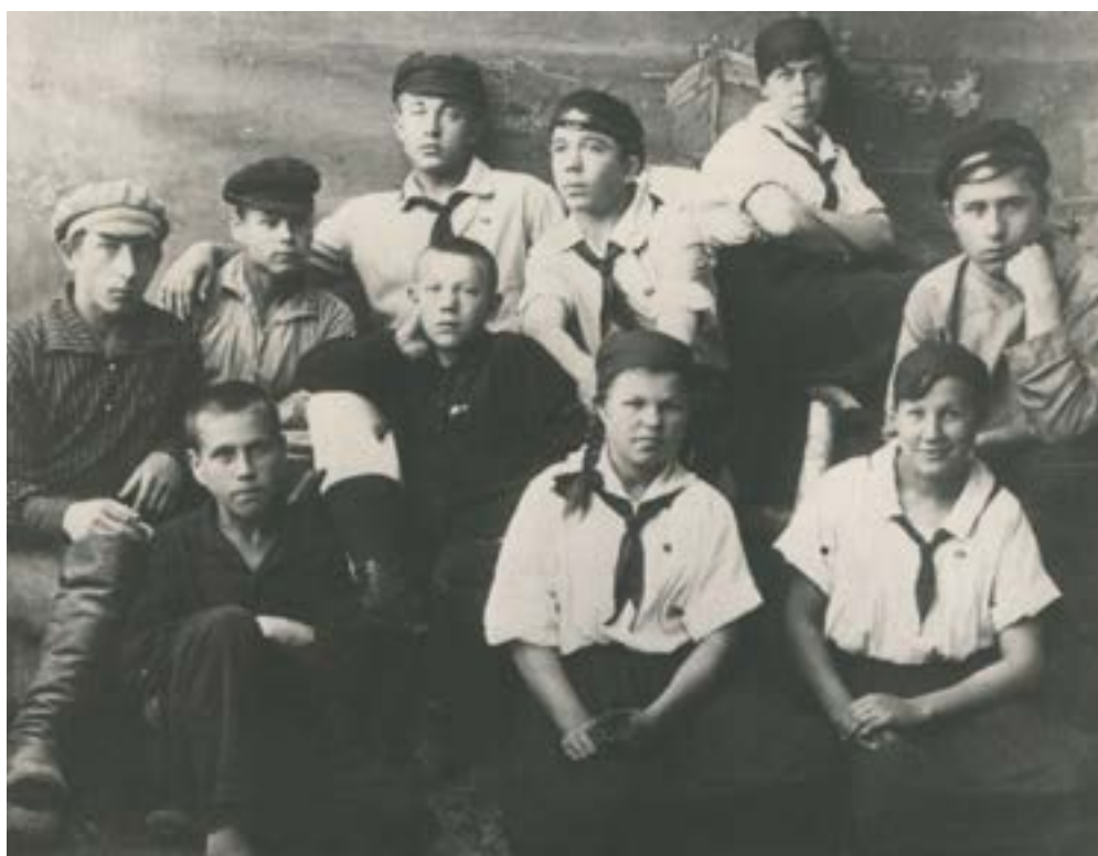
Группа руководителей Козьмодемьянских пионерских отрядов. 31 августа 1924 г.