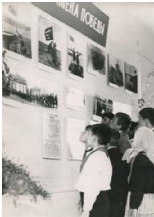
Рапорт марийских пионеров XXVII областной комсомольской конференции