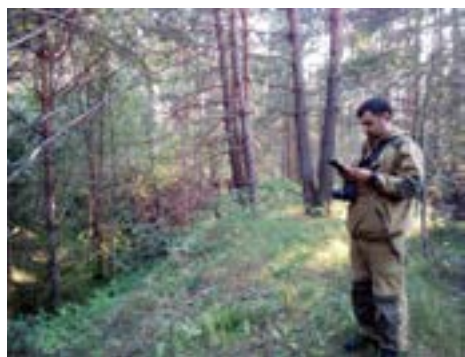
Определение GPS-координат памятника в Волжском районе в 2021 г.

3 этап – камеральный: на данном этапе проводится обработка полученных историко-архивных и полевых материалов.