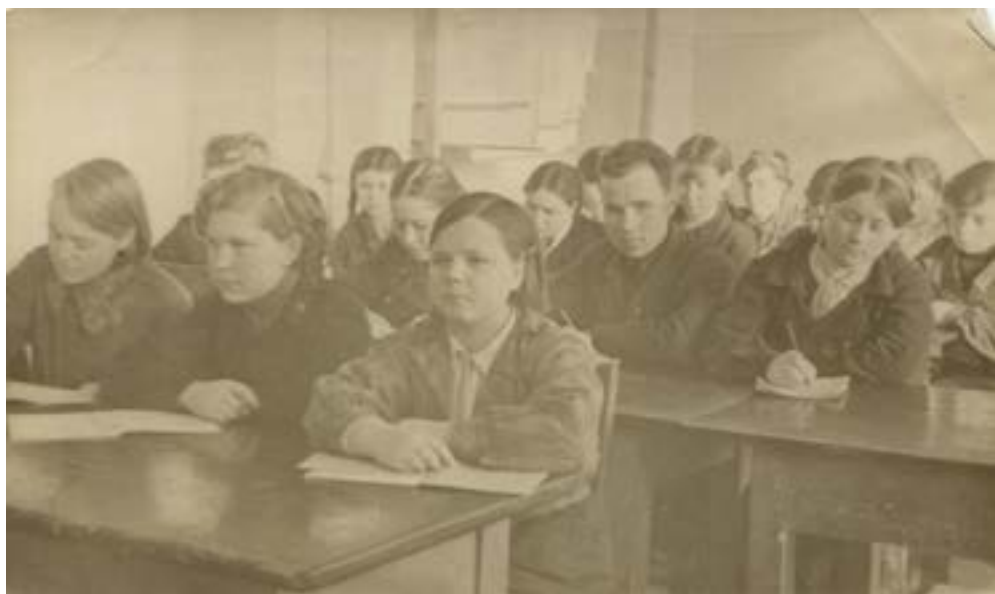
Курсы пионервожатых. 1924 г.