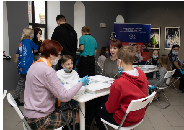
Мероприятия по реализации проекта «Эбру». Декабрь 2021 г.

Однако волонтерство в сфере культуры получило свой развитие позднее других направлений. Спектр задач для добровольцев в данной сфере достаточно широк: начиная с участия в проведении крупных культурных акций «Ночь музеев» и «Ночь искусств» и заканчивая работой в архивах и научных отделах музеев.