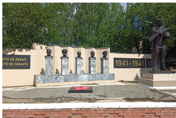
Мемориал памяти воинам, погибшим в годы Великой Отечественной войны. пос. Новый Торъял. 2021 г.