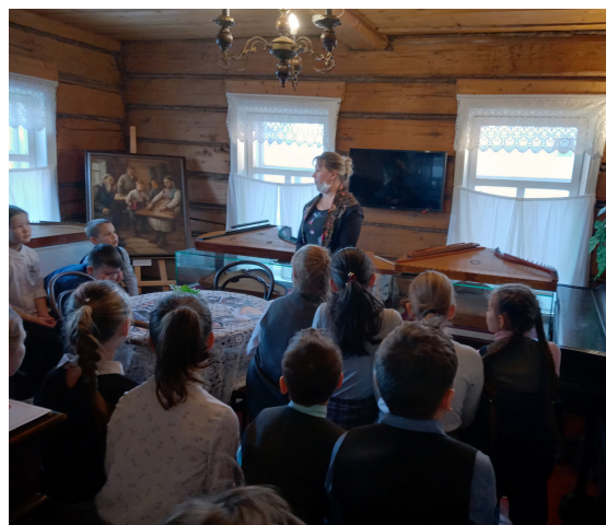
Музейно-образовательная программа «Марийские гусли»