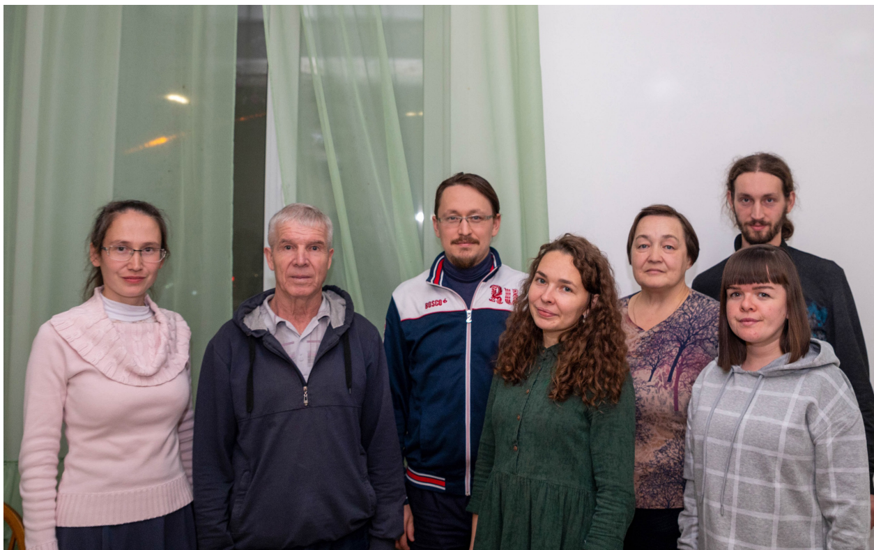
Участники проекта «Дорогами веры»

С 28 сентября по 4 октября 2021 г. в Горномарийском районе Республики Марий Эл проходила краеведческая экспедиция православной направленности. Мероприятие состоялось в рамках реализации проекта «Дорогами веры» при поддержке Росмолодежи и было организовано Музеем истории Православия (Пасынкова С. С.) совместно с Йошкар-Олинской епархией и МарНИИЯЛИ. В результате посещения 19 населенных пунктов и опроса 35 информантов собраны уникальные сведения об истории церкви в Марийском крае в XX в., проведена работа с материалами фондов архива (изучено 82 документа) и музея.