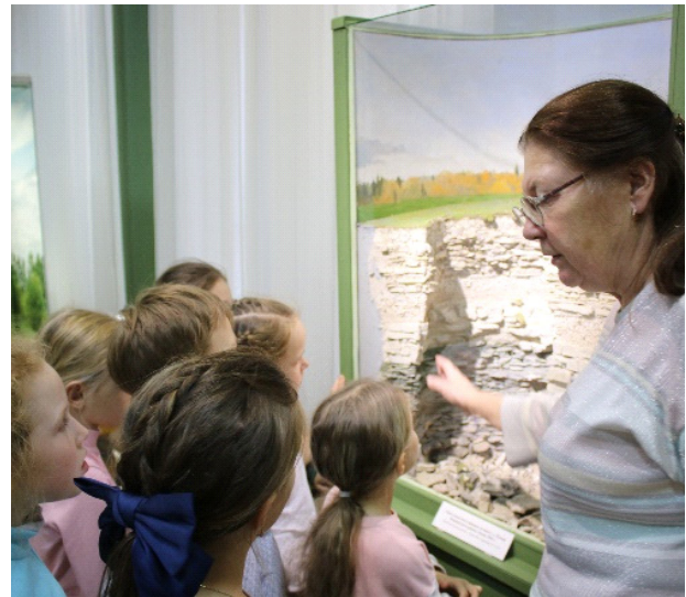
Обучающиеся компьютерной школы «Инфосфера» на музейно-образовательной программе «Синичкин день»

Многим посетителям полюбились Всероссийские акции «Ночь музеев» и «Ночь искусств», в рамках которых проводились семейные квесты, театрализованные программы и мастер-классы. Отдельным направлением в культурно-образовательной деятельности отдела является работа с людьми с ограниченными возможностями здоровья. В течение всего года сотрудники отдела вели тесное сотрудничество с Центром психолого-педагогической, социальной и медицинской помощи «Детство» и с Савинской школой-интернат.