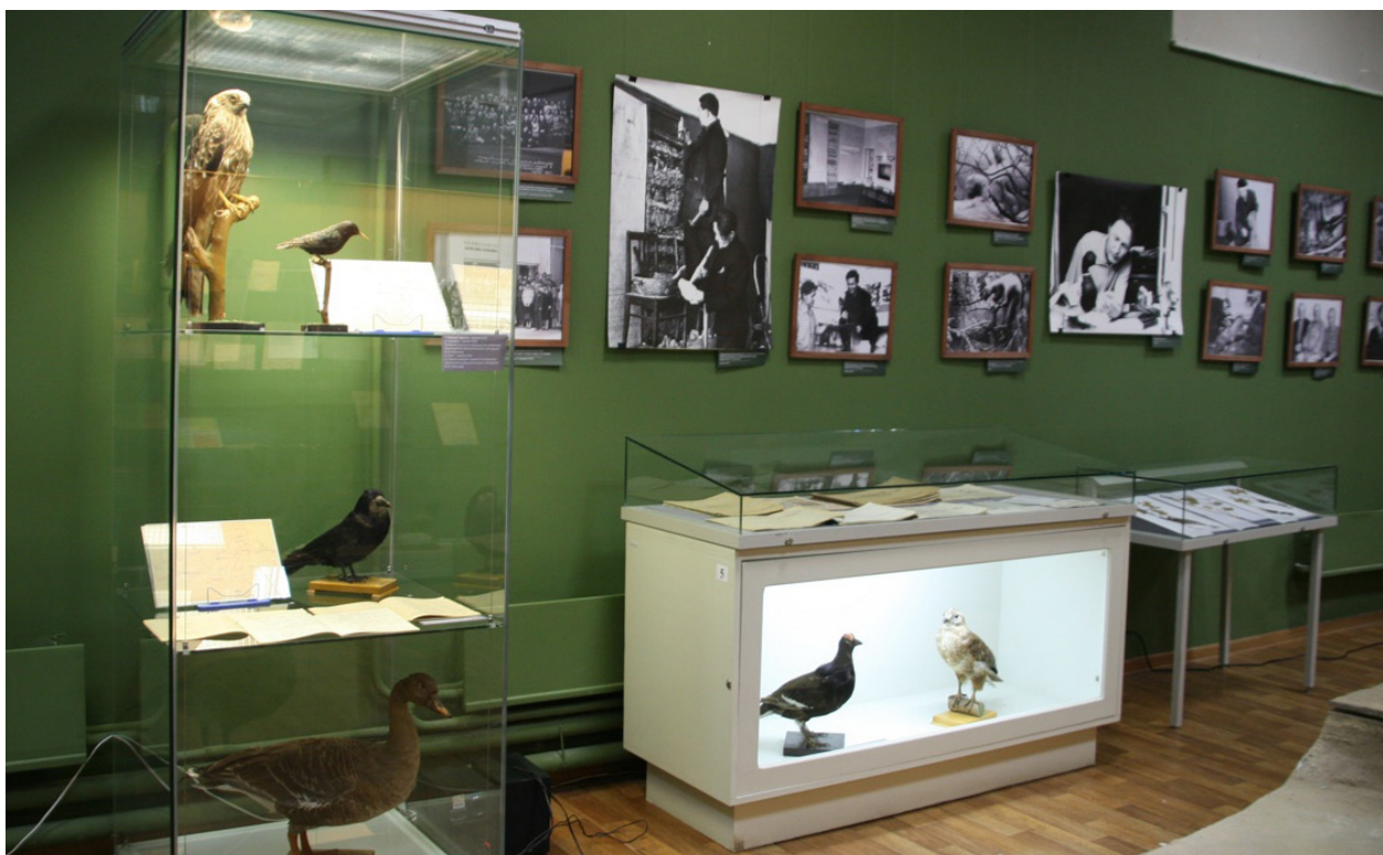
Фрагмент общего плана выставки