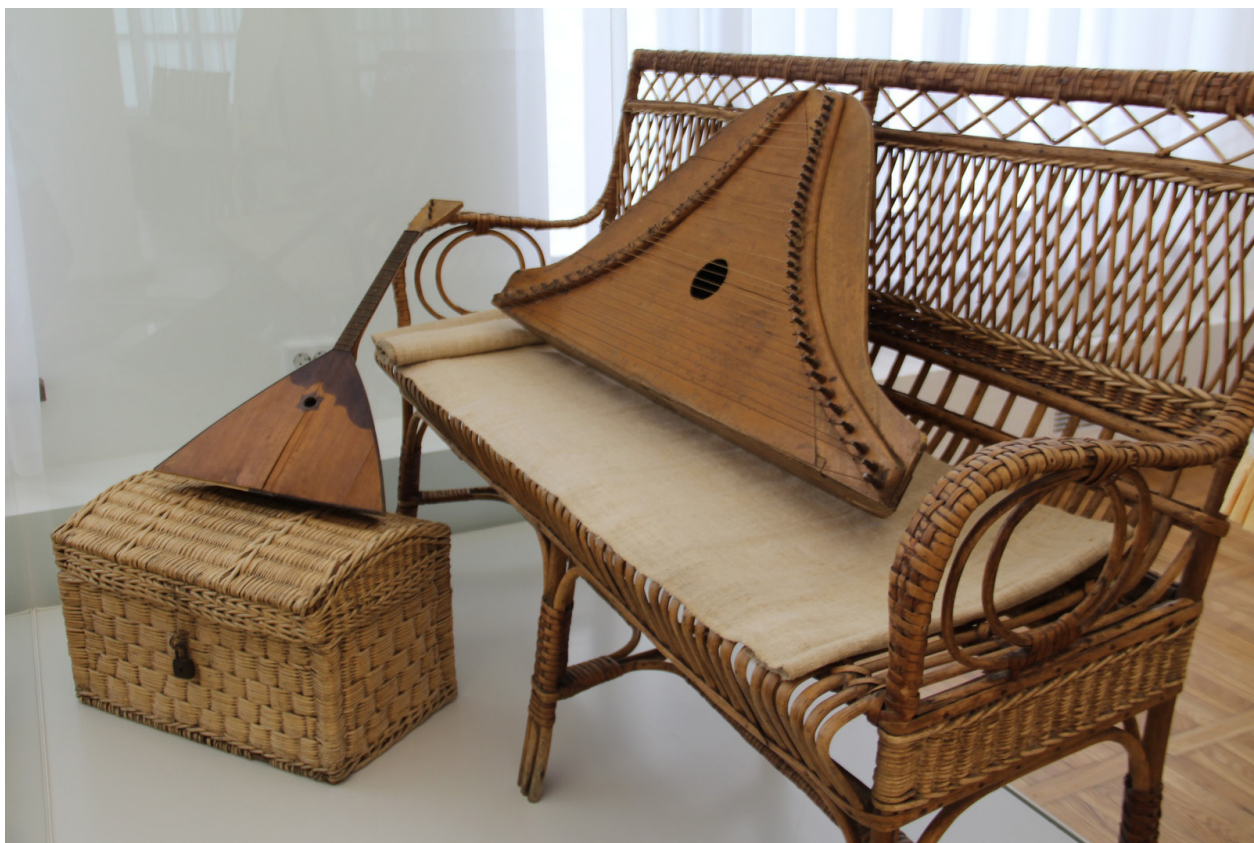
Экспонаты выставки «Ремесло – золотой кормилец» в Главном корпусе Национального музея Республики Марий Эл им. Т. Евсеева. 2021 г.

Выставка знакомит с основными и наиболее известными среди горных мари кустарными и ремесленными промыслами, получившими широкое распространение во второй половине XIX – первой половине XX вв. Её основу составили ценные и редкие этнографические памятники (орудия труда, инструменты и изделия мастеров-кустарей, мужские и женские костюмные комплексы, образцы традиционной вышивки, музыкальные инструменты), собранные музейными специалистами в ходе экспедиций в горномарийских селениях в 1960–2000-х годах.