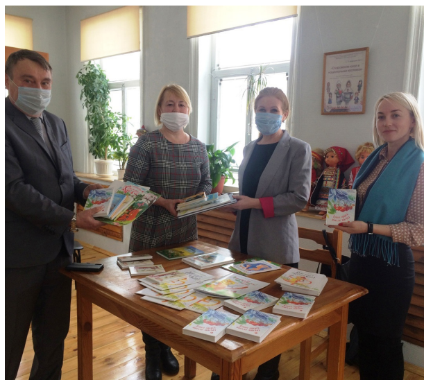
Творческая встреча «Жить по солнышку»