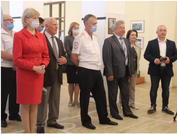
На открытии выставки «85 лет на страже дорог». 10 июня 2021 г.