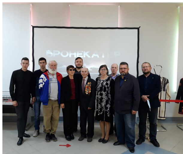
Заседание киноклуба «Историческая память» с просмотром документального фильма «Бронекатер»

В минувшем 2021 году несколько статей историков были опубликованы в различных изданиях: «Деятельность отдела истории»