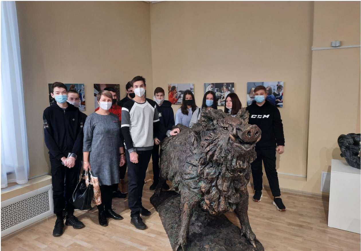
Посетители из Марийского лесохозяйственного техникума