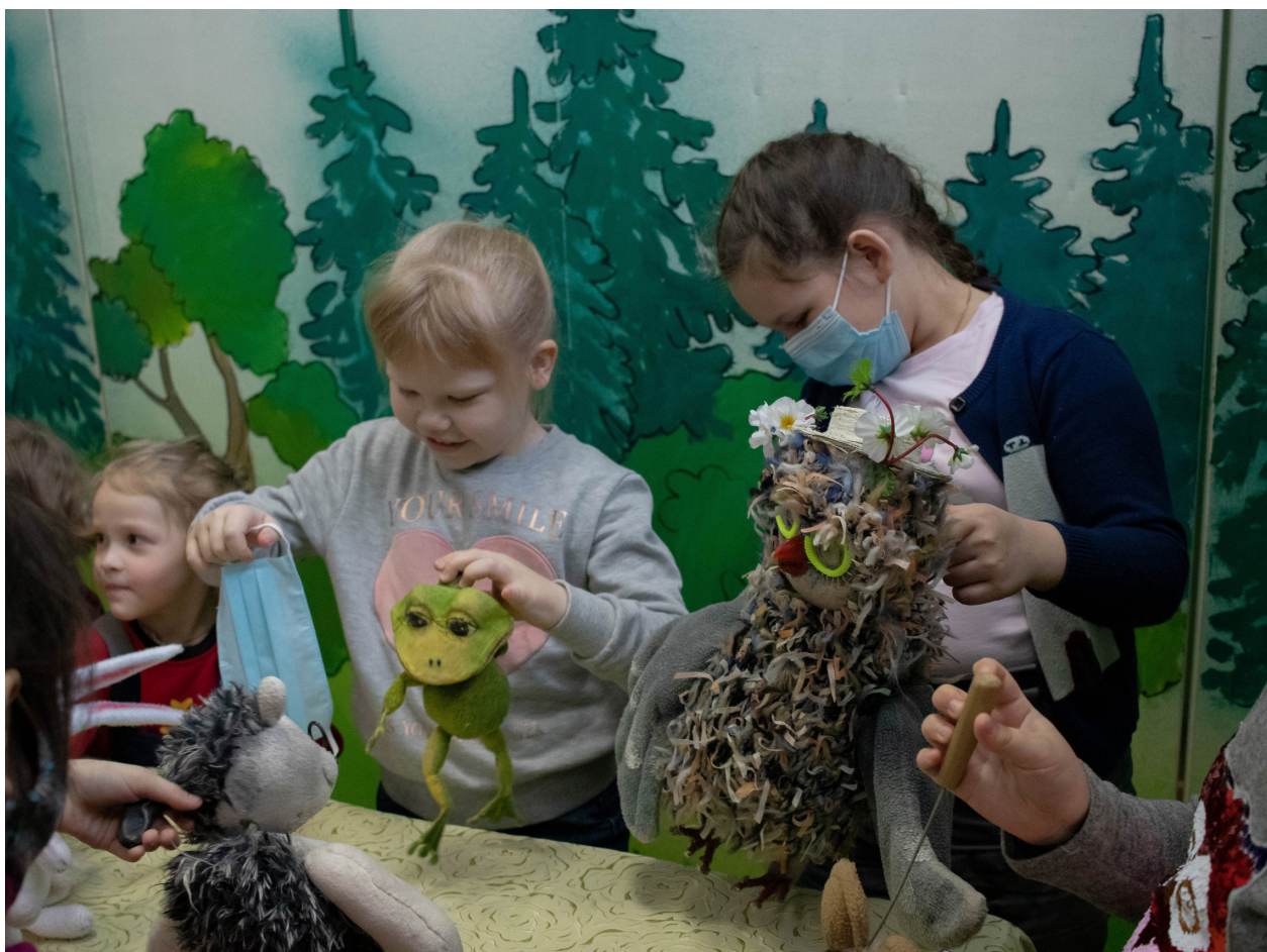
Участники культурной акции «Лес весенних чудес»

В международный день леса – 21 марта 2021 года, впервые состоялась культурная акция «Лес весенних чудес». В рамках акции прошла музыкальная экскурсия – «По тропинкам марийского леса». На увлекательных мастер-классах гостям музея удалось своими руками не только создать обитателей леса – сову и лисичку, но и смастерить украшения из дерева. Частью акции стало кукольное представление «Как лес весной просыпался», которое и перенесло ребят в мир со сказочными лесными героями. Каждый смог почувствовать себя не просто исследователем флоры и фауны марийского леса, но и настоящим кукловодом!