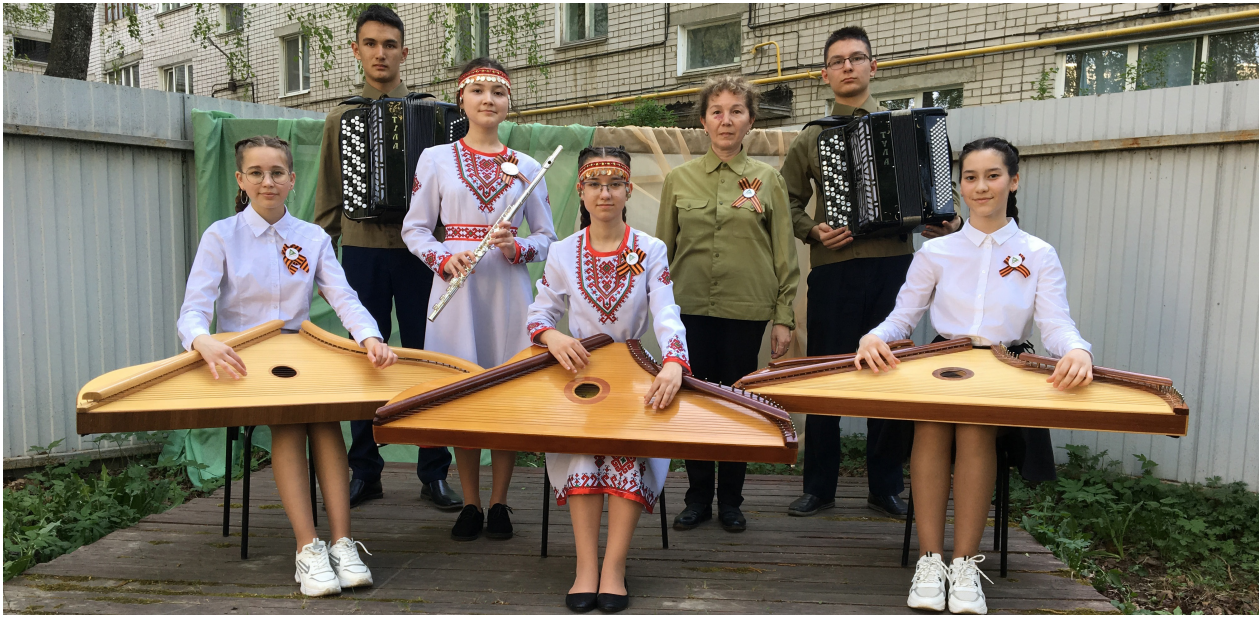
Во время культурной акции «Ночь в музее»