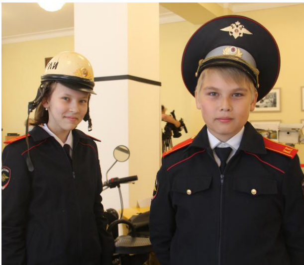
Будущие инспекторы ГИБДД