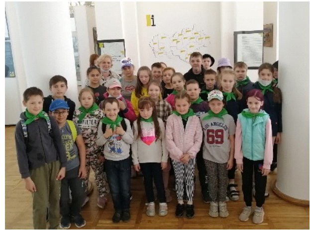
Посетители из пришкольных лагерей

В летний период особой популярностью, среди посетителей, пользовалась игра по станциям «Пять музейных элементов». Здесь юные посетители объединялись в команды исследователей этнографов, археологов, историков, биологов и даже палеонтологов и отправлялись в экспедиции по изучению музейных составляющих. Разделившись на отряды, они отгадывали загадки о животных, собрали сведения о хозяйственных занятиях у жителей марийской деревни и многое другое.