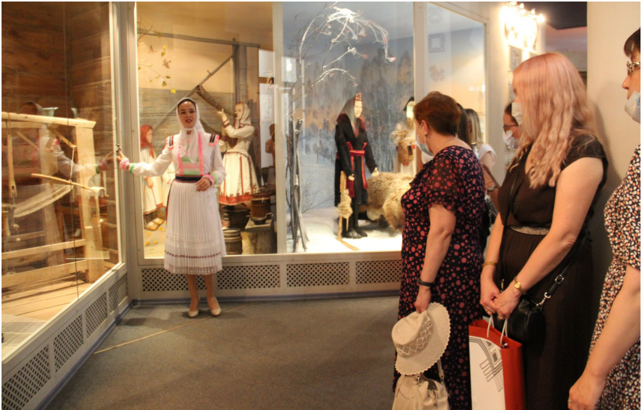
Методическая экскурсия по этнографической экспозиции музея с использованием системы звукового сопровождения. 15 июня 2021 г.