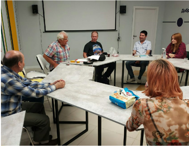
На поэтическом вечере ко Дню филолога. Центр добровольчества при Дворце молодёжи Республики Марий Эл. г. Йошкар-Ола. 25 мая 2021 г.