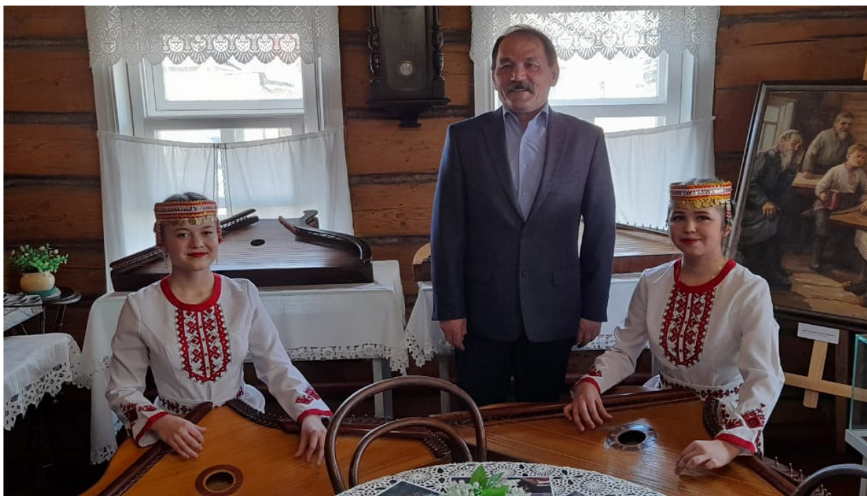
Открытие выставки «Кўсле»