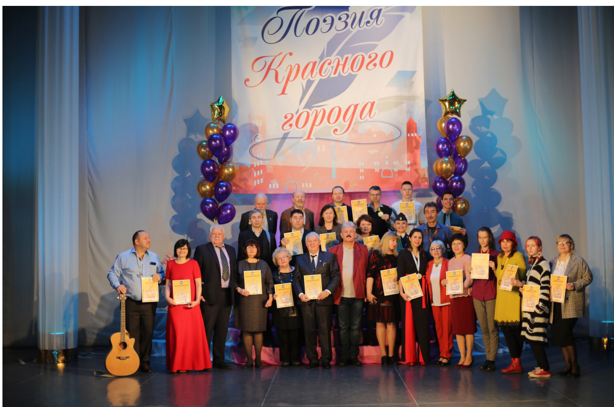
Лауреаты и дипломанты V городского открытого конкурса «Поэзия Красного города». Дворец культуры им. XXX-летия Победы. 21 ноября 2021 г.

присылали на электронную почту конкурса видеозаписи с исполнением произведений из числа присланных на конкурс. Таким образом, итоги конкурса были подведены по результатам оценивания присланных видео с исполнением конкурсных работ. Примечательно, что во время самого торжественного мероприятия на сцене перед зрителями выступили не только участники конкурса, но и все желающие, в том числе гости из Чувашии и Татарстана, которые прочитали стихи и исполнили песни собственного сочинения. Были продемонстрированы видео с исполнением конкурсных работ лауреатами и дипломантами, которые не смогли присутствовать на церемонии. Лауреаты в каждой возрастной категории получили заслуженные награды, также члены жюри присудили некоторым участникам спецдипломы. Участникам, прошедшим предварительный отбор и присутствовавшим на мероприятии, были вручены сертификаты, подтверждающие участие в конкурсе. Остальным участникам, которые по той или иной причине не смогли прибыть на церемонию, соответствующие наградные документы высылаются Почтой России и в электронном виде (по согласованию). Отметим, что благодарности получили также члены жюри за кропотливую работу по отбору и оцениванию конкурсных работ и волонтеры – за активную помощь в организации и проведении конкурса.