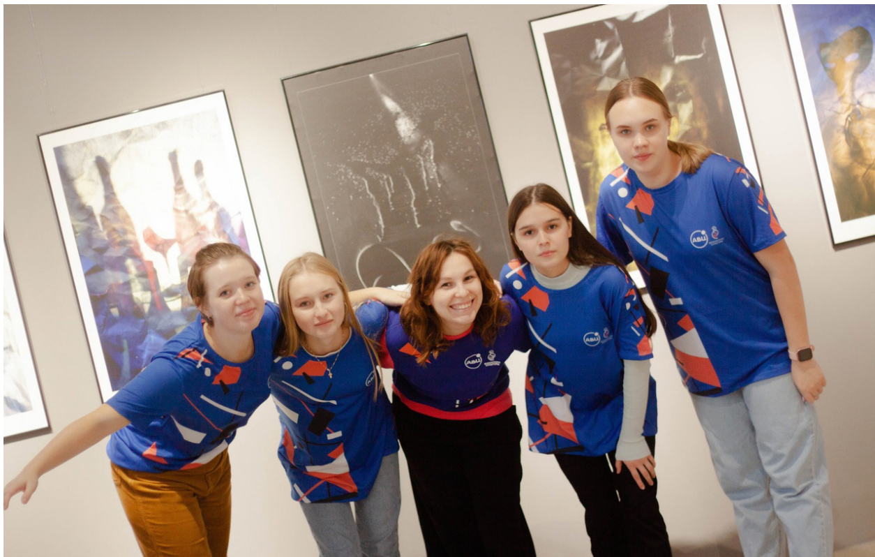
Волонтеры культуры на праздновании Международного дня добровольца. 5 декабря 2021 г.

Активную политику в отношении привлечения волонтеров, как правило, ведет и Национальный музей Республики Марий Эл им. Т. Евсеева. Региональное отделение Всероссийского общественного движения «Волонтеры культуры» официально существует в республике с 2020 г. В команде проекта большая часть – школьники и студенты в возрасте от 14 до 22 лет.