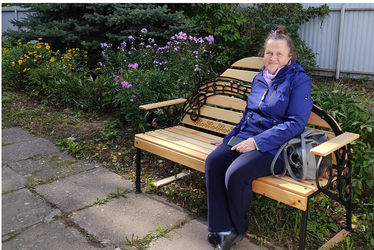
Арт-объект – скамейка «Звучащие гусли»

Так, модернизация Дома-музея им. И.С. Ключникова-Палантая современной техникой и благоустройство территории качественно и гармонично дополнили классическую экскурсию для посетителей.