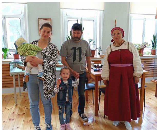
Культурная акция «Выходные в музее»