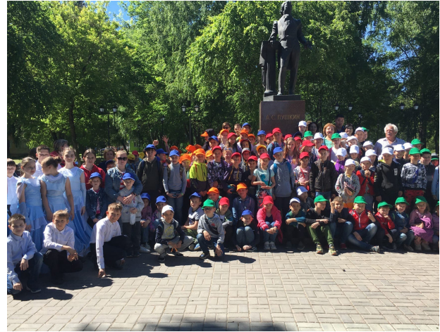
Организаторы и участники праздника поэзии у памятника А. С. Пушкину. г. Йошкар-Ола. 6 июня 2021 г.

6 июня, в День рождения великого русского поэта А. С. Пушкина и День русского языка, у памятника поэту в сквере Йошкар-Олы прошёл праздник поэзии, организатором которого выступила гимназия № 4, носящая имя поэта. Поэты Т. Кадышева, А. Шурыгин, К. Шемякин, С. Земцов, М. Василевская, А. Тарасов, Г. Чиркова читали свои стихи, посвящённые поэзии и непосредственно Александру Сергеевичу. Ансамбль 4-х классов гимназии представил различные танцы, которые танцевали на балах в начале XIX века. Чтецами были и сами гимназисты участники пришкольного детского лагеря.