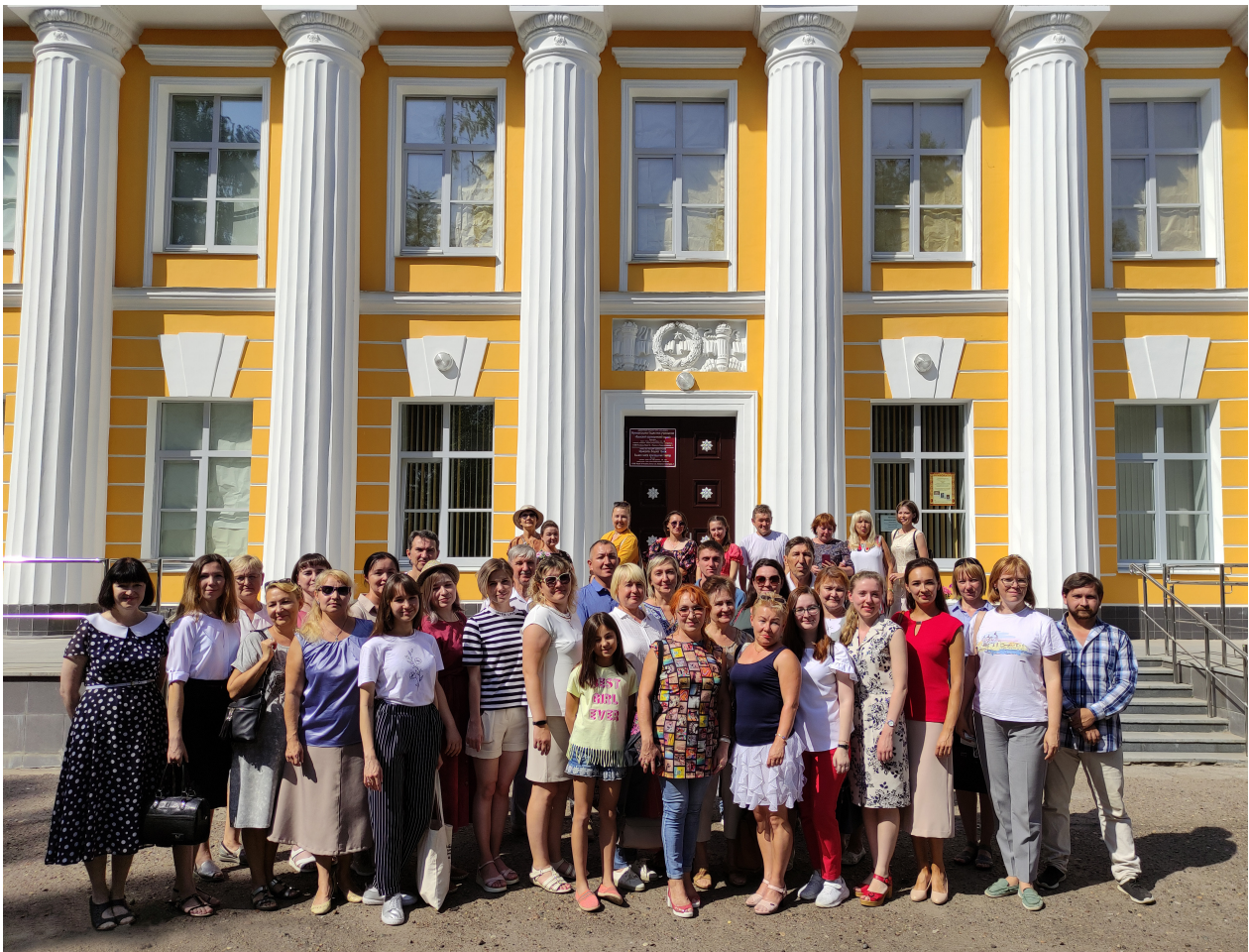
Республиканский семинар «Интеграция музея в региональное социокультурное пространство на примере работы МБУ «Волжский краеведческий музей» для сотрудников муниципальных музеев. 19 августа 2021 г.

19 октября специалисты музеев Марий Эл стали участниками семинара «Мультимедийные технологии в тематических музеях г. Казани», который проходил на базе Государственного историко-архитектурного и художественного музея-заповедника «Казанский Кремль» и Национального музея Республики Татарстан. Программа семинара была очень насыщенной: специалисты посетили Музей естественной истории Татарстана, Музей истории государственности татарского народа и Республики Татарстан, Музей-мемориал Великой Отечественной войны 1941–1945 гг. и Исторический парк «Россия – моя история».