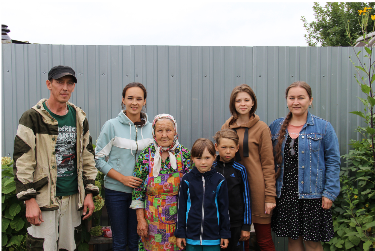
Участники этнографической экспедиции музея с информантами. Моркинский район, д. Чодраял. 2021 г.

10–14 августа состоялась этнографическая экспедиция в Моркинский район. В ходе обследования были посещены 5 марийских деревень: Фадейкино, Юрдур, Мари-Кужеры, Чодраял, Кутюк-Кинер; 1 русская – Старое Мазиково и 1 татарская деревня – Кульбаш. Участниками экспедиции было собрано 38 предметов быта, внутреннего убранства дома и традиционного костюма «шарпан-нашмакан мари» первой половины XX в. Было опрошено 26 информантов 1930–1960-х гг. р. Исследовано 5 священных рощ. Участниками экспедиции были записаны марийские колыбельные, свадебные и похоронно-поминальные песни из уст информантов 1930–1940-х гг. р. Были собраны первичные полевые материалы, связанные с локальными особенностями проведения свадебных, родильных и похоронно-поминальных обрядов, домостроительной обрядности, календарных праздников при волжской группе луговых мари и русского народа. С культурой и бытом татарского народа этнографы познакомились в ходе опроса «абыстай» – главной женщины в деревне Кульбаш.