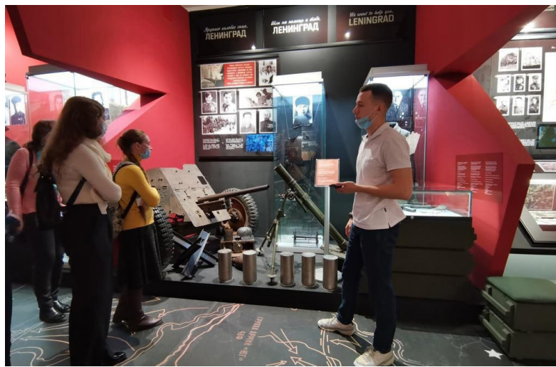
Семинар «Мультимедийные технологии в тематических музеях г. Казани». 19 октября 2021 г.

Национальный музей РМЭ им. Т. Евсеева 25 ноября 2021 г. провел республиканский научно-практический семинар для сотрудников муниципальных музеев Республики Марий Эл в очно-дистанционном формате.