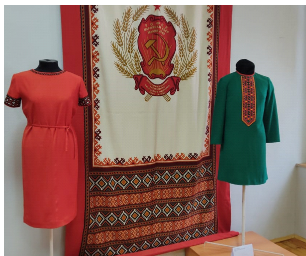
Фрагмент выставки «Гордость республики. Фабрика строчевышитых изделий “Труженица”»