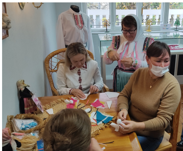
Мастер-класс в рамках выставки Ардинского Дома ремесел Килемарского района «Край родной мастеровой»

Анализ отзывов, предложений посетителей музея и организаторов выставки показал, что промыслы и ремесла народа мари не теряют своей актуальности и сегодня, и в каком направлении они будут развиваться – покажет время. Некоторые мастера считают, что в настоящее время, чтобы сохранить уникальные образцы прикладного творчества прошлых столетий, целесообразно создавать по оригиналам копии этих работ. Другие предлагают переосмыслить традиционные задумки и наработки, находить для них новое звучание. Таким образом, большинство марийских народных промыслов продолжают жить, развиваться и эффективно взаимодействовать с современной культурой и искусством, занимая здесь особую нишу.