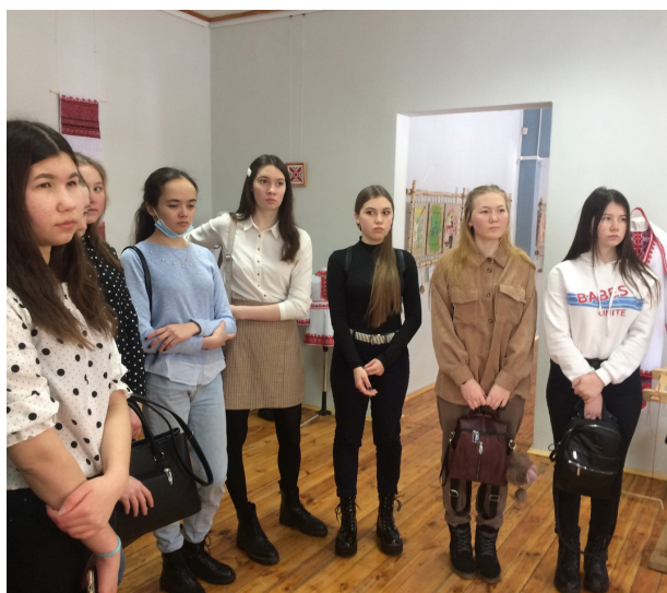
Творческая встреча «Жить по солнышку»