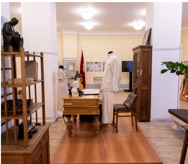
Фрагмент выставки «Больше, чем газета»: к 100-летию «Марийской правды»