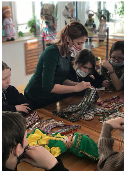
Творческая встреча в рамках выставки «Очарования кукол в национальных костюмах»