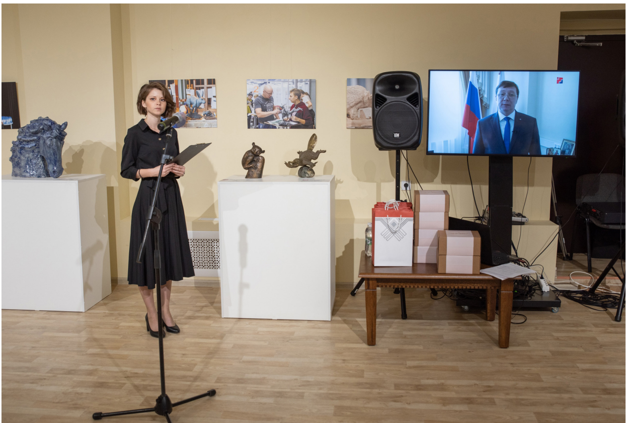
Перед открытием выставки «Анималия. Трогательная выставка» в Главном корпусе Национального музея Республики Марий Эл им. Т. Евсева. 15 октября 2021 г.