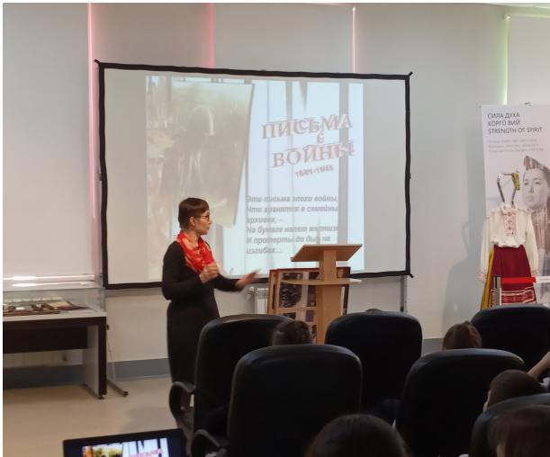
Музейно-образовательная программа «Письма с войны»