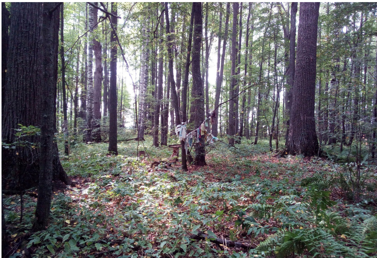
Вид на моленную площадку

С 26 июля по 15 августа археологический отряд Комплексной экспедиции музея провел мониторинговые исследования 53 памятников археологии, расположенных в Волжском, Горномарийском, Моркинском, Параньгинском, Советском районах (Ефремова Д. Ю., Курочкина С. А., Бойко И. В.). В ходе исследований в Волжском районе было найдено 19 памятников разных эпох (6 стоянок, 4 селища, 2 поселения, 5 могильников, 2 священные рощи; открыты в 1956, 1975, 1978 и 2003 гг.). В Моркинском районе обследовано 25 памятников разных эпох (6 стоянок, 4 поселения, 1 городище, 12 могильников, 2 священные рощи; открыты в 1925, 1947, 1950–1990-х, 2003, 2007 гг.). В Горномарийском районе осмотрено 7 памятников разных эпох (1 городище, 1 селище, 2 курганные группы, 3 жертвенника; открыты отрядами КАЭ МГУ и Марийской археологической экспедиции в 1928, 1958, 1999, 2001–2002 гг.). В Параньгинском и Советском районах обследованы Усолинское и Тапшерское мольбища (священные рощи), имеющие статус памятников федерального значения.