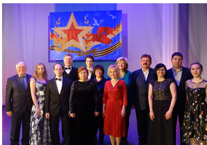
Участники концерта «Доблестные сыны России» ко Дню защитника Отечества. Дворец культуры им. XXX-летия Победы. г. Йошкар-Ола. 22 февраля 2021 г.