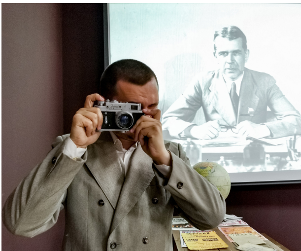
Инсценировка «В музее рождались открытия». Акция «Ночь в музее»