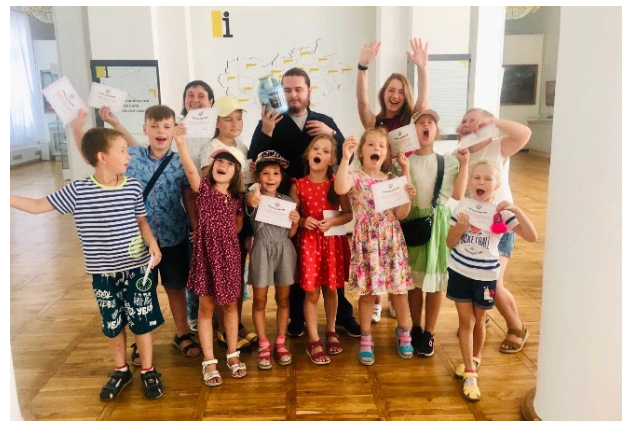
Музейная детская смена «Лето». Июль 2021 г.