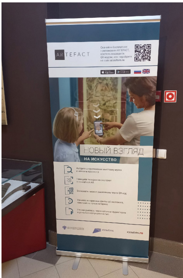
Roll-up с информацией о платформе Artefact в экспозиции «Марийский край. Вехи истории»

Памятным событием не только для Национального музея, но и для всего музейного сообщества Марий Эл стала реализация в рамках Национального проекта «Культура» мультимедиа-гида с применением технологии дополненной реальности на основе цифровой платформы Artefact. Стартовой площадкой для этого направления в нашей республике стала экспозиция Музея истории и археологии «Марийский край. Вехи истории». Для того, чтобы Artefact появился, была проведена большая подготовительная работа, в которой участвовали и научные сотрудники разных отделов Национального музея, и редакция платформы Artefact. Были подготовлены описания выставок и экспонатов (на русском и английском языках), проведена каталожная съемка предметов и настроена дополненная реальность. Теперь посетители музея, воспользовавшись своим смартфоном, могут узнать дополнительную информацию о некоторых предметах экспозиции.