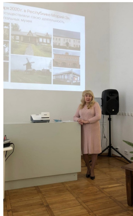
Республиканский семинар «Итоги деятельности муниципальных музеев Республики Марий Эл за 2020 год и перспективы развития на 2021 год» для руководителей муниципальных музеев. 12 февраля 2021 г.