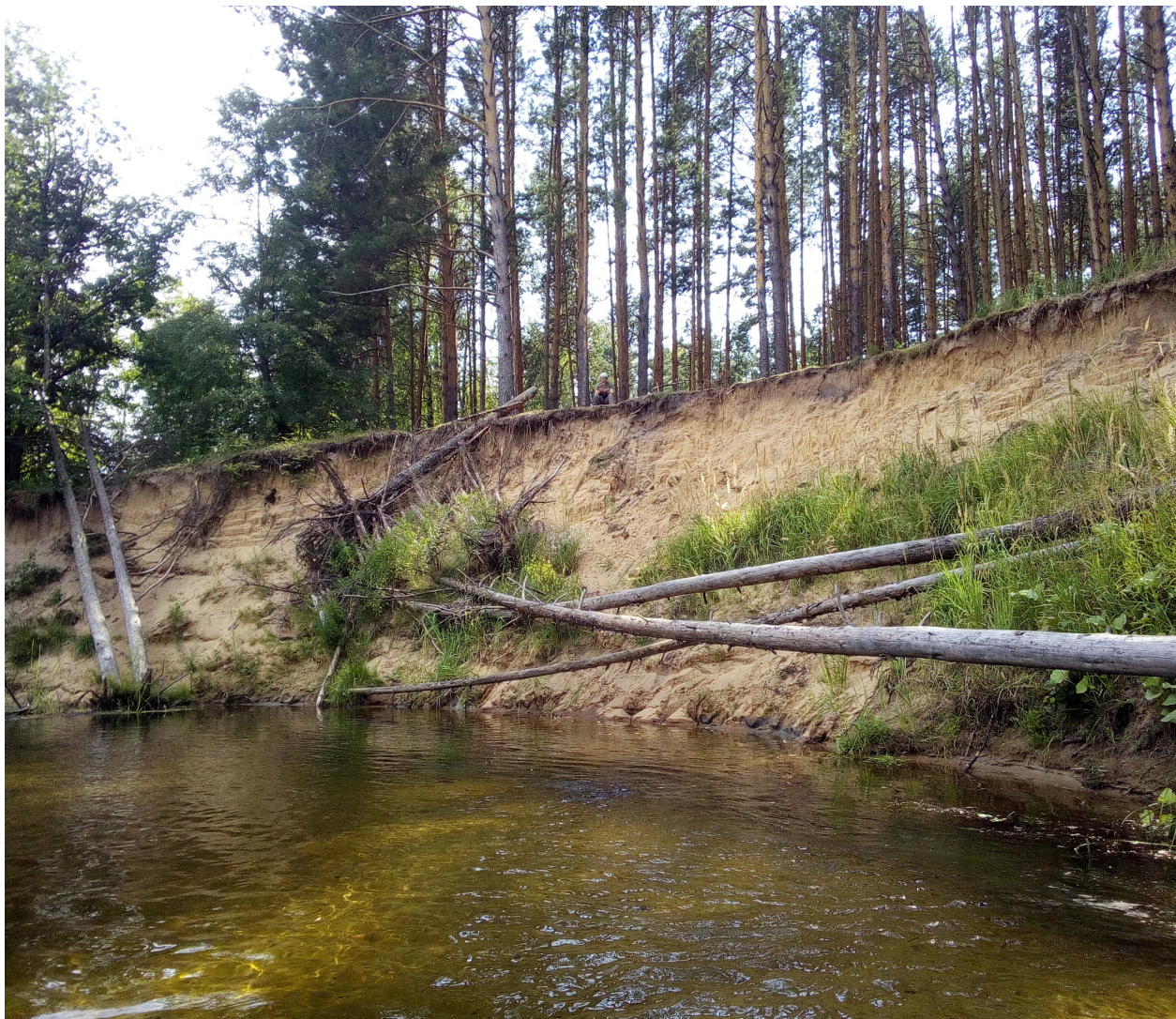
Мониторинг памятников археологии в Моркинском районе