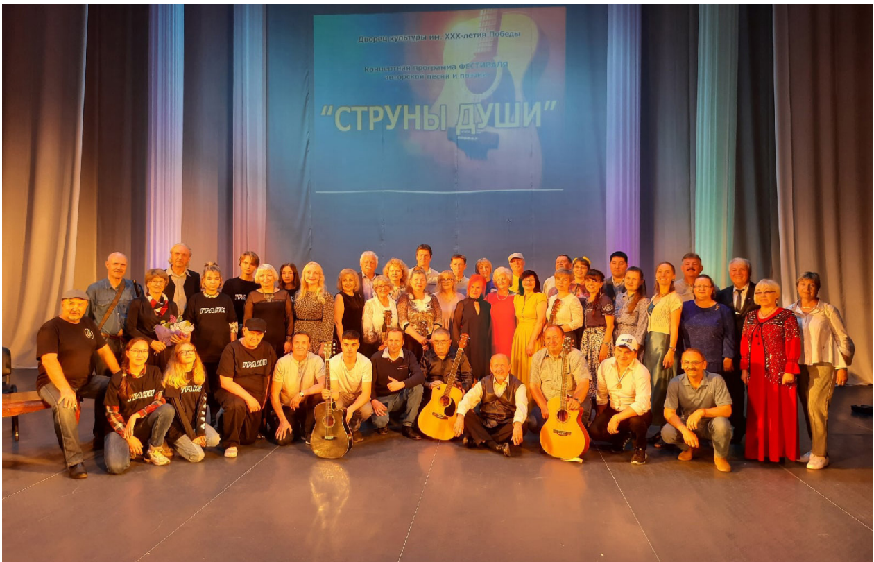
Участники Межрегионального фестиваля авторской песни и поэзии «Струны души». Дворец культуры им. XXX-летия Победы. 22 мая 2021 г.