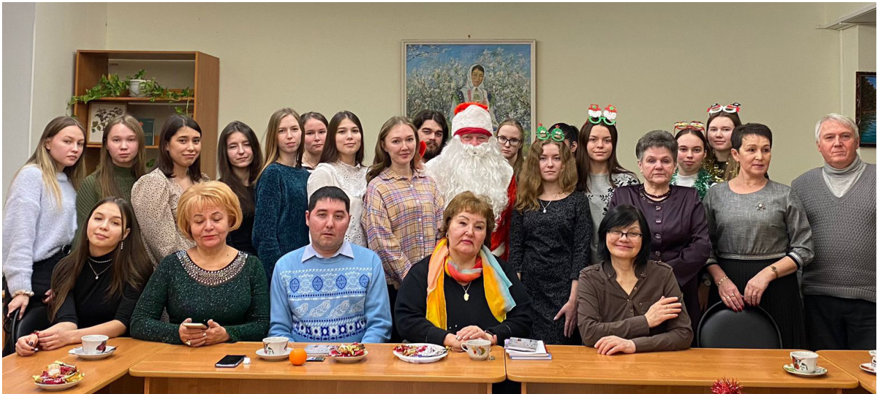
Организаторы и участники предновогодней встречи студенческого музыкально-поэтического клуба «Вдохновение». Научная библиотека МарГУ им. Р.А. Пановой. г. Йошкар-Ола. 24 декабря 2021 г.