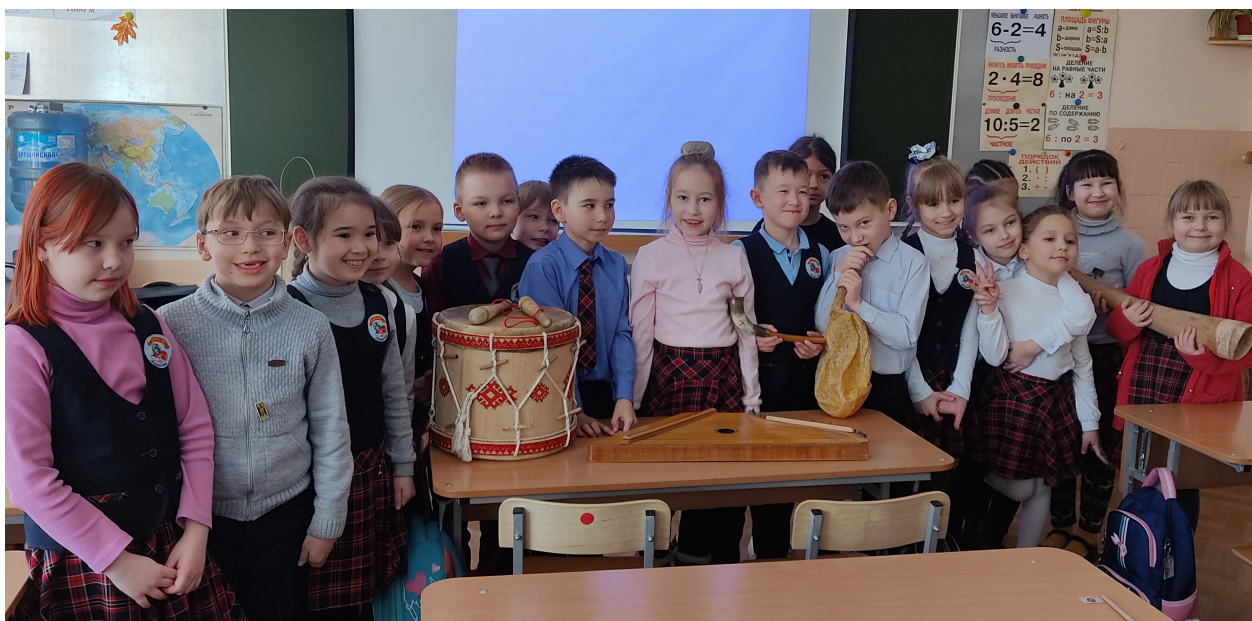
Выездная программа в детской школе искусств № 7 г. Йошкар-Олы

Традиционными в деятельности учреждения остаются такие культурные акции, как «Палантаевский апрель», «Ночь музеев», «Международный день музыки» и «Ночь искусств».