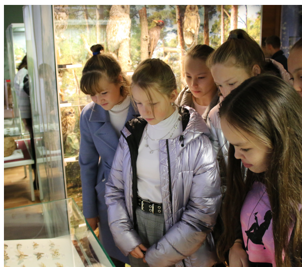
Посетители по Пушкинской карте