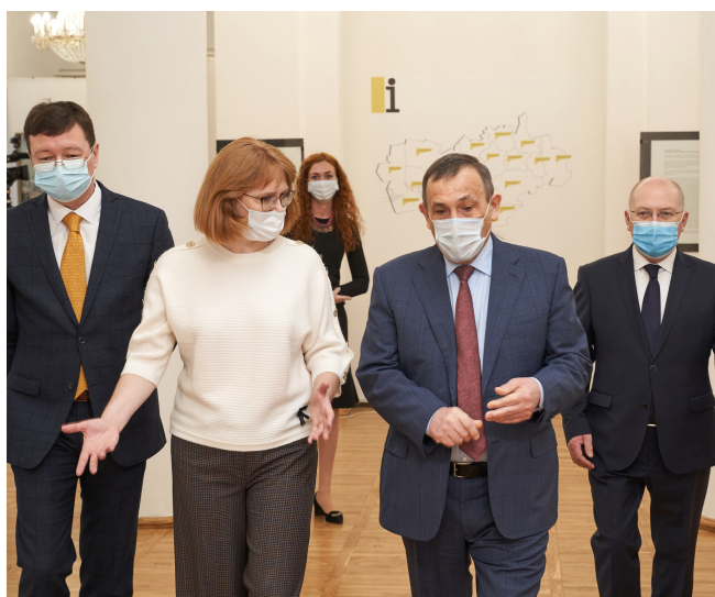
Почетные гости на открытии выставки «Курымашлык вий – Вековая сила марийской земли». Декабрь 2020 г.