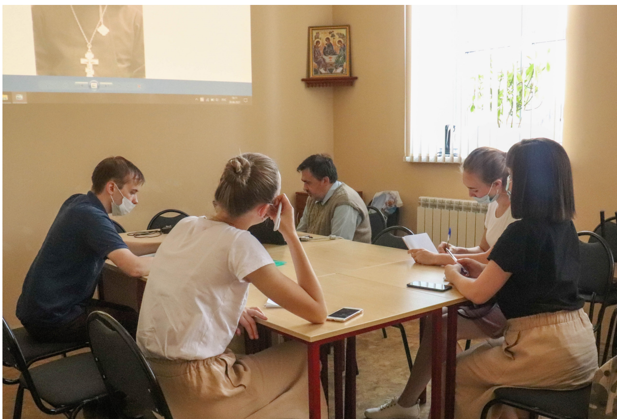
Добровольцы на одной из подготовительных бесед в Музее истории Православия. 30 июня 2021 г.