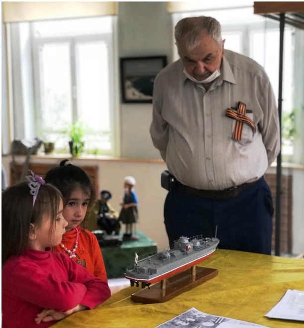
Творческая встреча «Мои детские воспоминания»