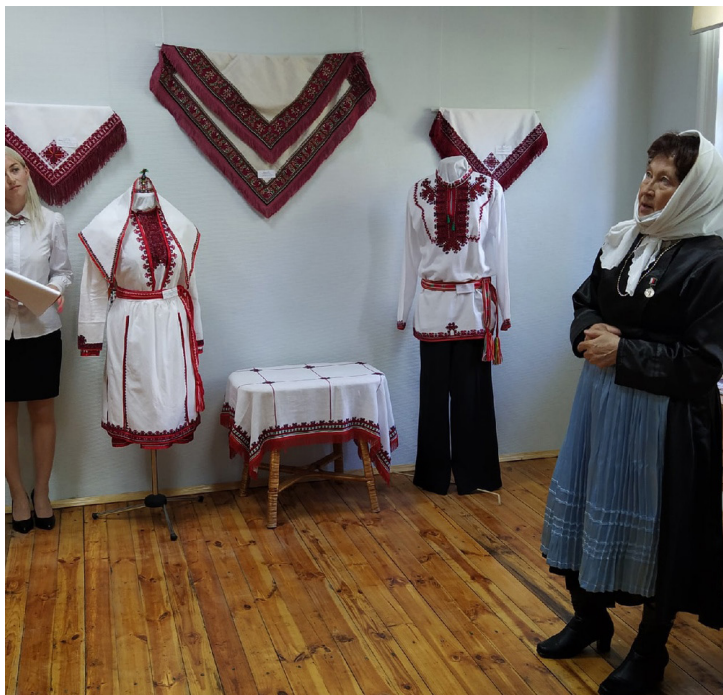
Открытие выставки «Искусство марийской вышивки: от традиции к современности»

в VI Национальном чемпионате по профессиональному мастерству среди инвалидов и лиц с ограниченными возможностями здоровья «Абилимпикс» и заняла 2 место в категории «Специалисты» компетенции «Художественное вышивание». В рамках этой выставки были проведены тематические занятия и мастер-классы, студийные программы для семейных групп, подростков и студентов. Самыми активными участниками были семейные группы – дошкольники 5–8 лет с родителями. Программы проводились в рамках проектной деятельности «Моя Родина – Республика Марий Эл» по договору о сотрудничестве между ГБУК «Национальный музей РМЭ им. Т. Евсеева» и дошкольными образовательными учреждениями микрорайона «Сомбатхей» г. Йошкар-Олы.