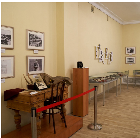
Фрагмент выставки «Национальному музею РМЭ имени Т. Евсеева – 100 лет!»

В течение 2021 года продолжили работу два крупных выставочных проекта: «Национальному музею РМЭ имени Т. Евсеева – 100 лет!», посвященный истории становления и развития ведущего музея региона через уникальные предметы из фондов музея, и выставка «Курымашлык вий – Вековая сила марийской земли» приуроченная к 100-летию автономии марийского народа, где были представлены известные достопримечательности каждого района Республики Марий Эл.