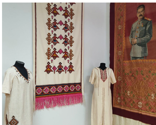
Фрагмент выставки «Гордость республики. Фабрика строчевышитых изделий “Труженица”»