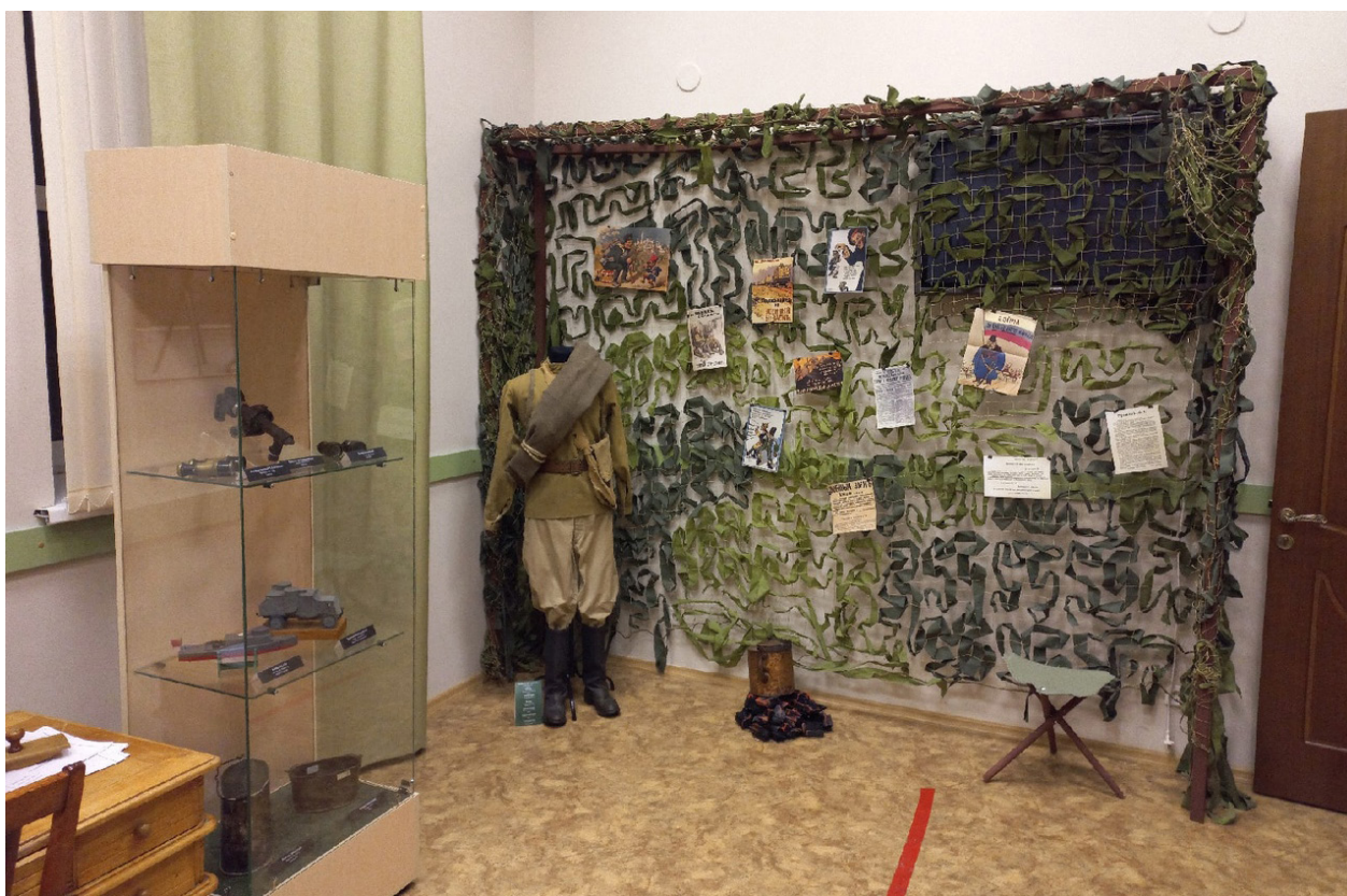
Выставка «Солдаты трёх государств»

Военной истории России посвящена еще одна выставка отдела – «Солдаты трех государств», оформленная также на базе Музея истории православия. На материалах из фондов Национального музея Первая мировая война была представлена на примере жизни людей провинциального Царёвококшайска. Органично вписались в структуру выставки макеты военной техники того периода, предоставленные МБОУ ДО «Станция юных техников г. Йошкар-Олы».