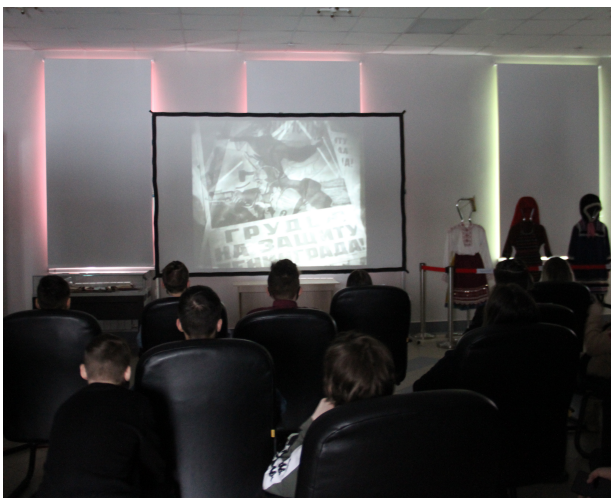
Показ художественного фильма «Жила-была девочка»

нировку «В музее рождались открытия» (о деятельности Государственного оптического института во главе с С. И. Вавиловым в Йошкар-Оле в годы эвакуации) для акции «Ночь в музее»; провели мероприятие «Они отстояли Москву» (к 80-летию Битвы под Москвой и ко Дню защитника Отечества) и акцию «Вместе» (к 7-й годовщине присоединения Крыма к России).