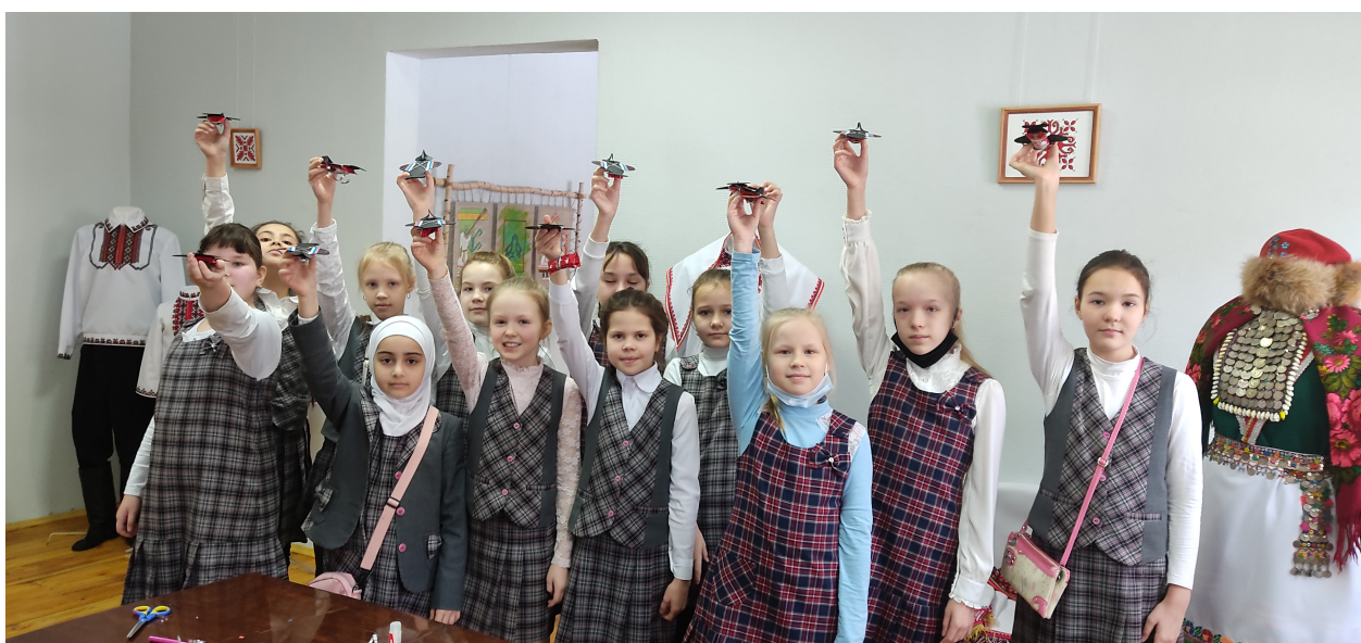
Участники выездного мастер-класса