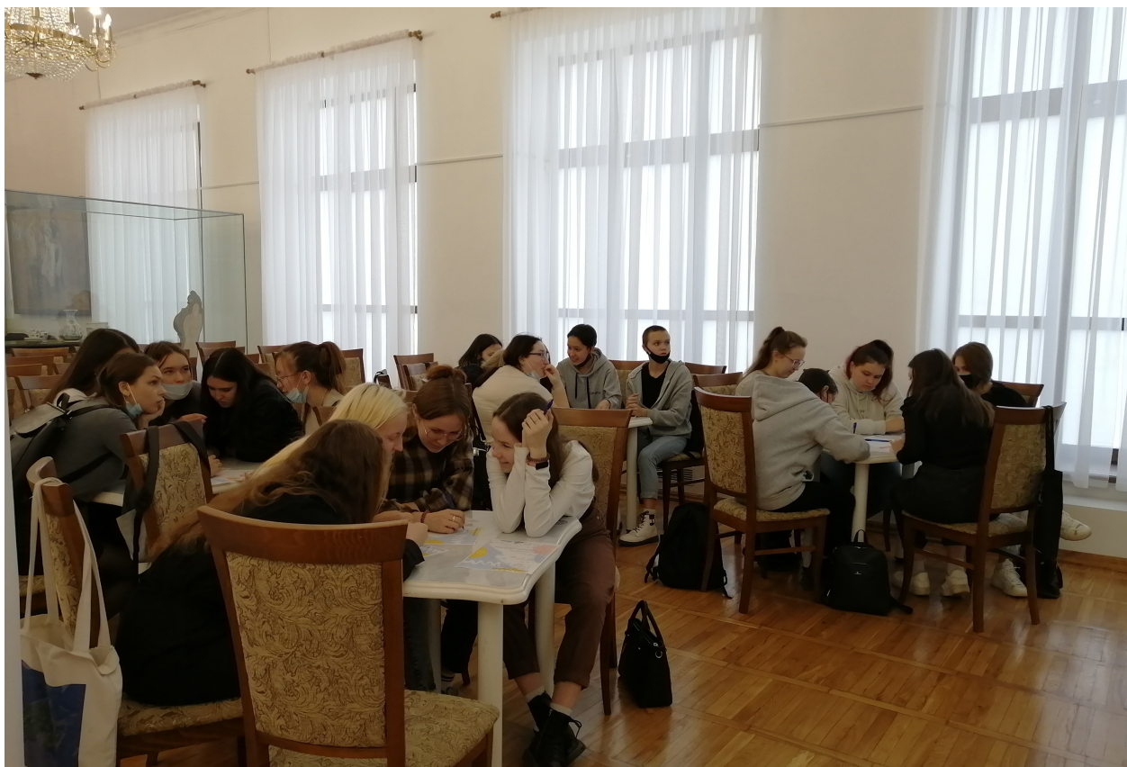
Студенты строительного техникума на квизе «Наследники Победы»

Большое значение в деле воспитания подрастающего поколения имеют и мероприятия патриотической направленности, посвящённые Дню защитника Отечества и Дню Победы в Великой Отечественной войне. Популярностью пользовались интеллектуальные командные игры-квизы. Для студентов Йошкар-Олинского строительного техникума была проведена игра «Наследники Победы». Во время квиза участники в игровой форме нашли ответы на более чем 50 вопросов об искусстве и кинематографе, фактах и деталях событий военных лет. По итогам игры, команда «Чекисты» набрала наибольшее количество баллов. Отраднo, что и участники команды «Восток» не огорчились своему поражению! Всем участникам игры были вручены памятные подарки.