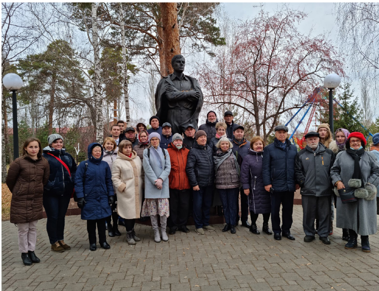
Участники V Межрегионального музыкально-поэтического фестиваля «Рукопожатие республик» у памятника поэту Б. Пастернаку. г. Чистополь. 3 ноября 2021 г.

А. Тарковский, А. Твардовский, М. Исаковский, М. Цветаева, А. Сурков и многие другие знаменитые отечественные писатели. Завершился фестиваль 4 ноября возложением цветом к памятнику Г. Р. Державину в Лядском саду в Казани. Также для участников фестиваля провели обзорную экскурсию по уютному Литературному музею Е.А. Боратынского. Большое впечатление произвели увидели многие уникальные экспонаты, в том числе небольшой письменный стол, раскладывающийся для игры в карты, ведь за этим столом во время визита в Казань в сентябре 1833 года работал сам гений русской поэзии Александр Сергеевич Пушкин! В целом фестиваль оставил неизгладимые положительные впечатления, для авторов из Республики Марий Эл было честью выступить на таком уровне: не только представить своё творчество, но и обрести новые творческие контакты с авторами из других поволжских республик!