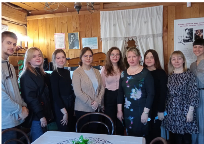
Во время обзорной экскурсии для студентов Колледжа культуры и искусств им. И.С. Палантая

Основные итоги проекта освещались в региональных СМИ и социальных сетях. Кроме того, проект «Күсле» («Марийские гусли») был представлен туроператорам Республики Марий Эл. С учетом их пожеланий были намечены планы по взаимодействию в 2022 году.