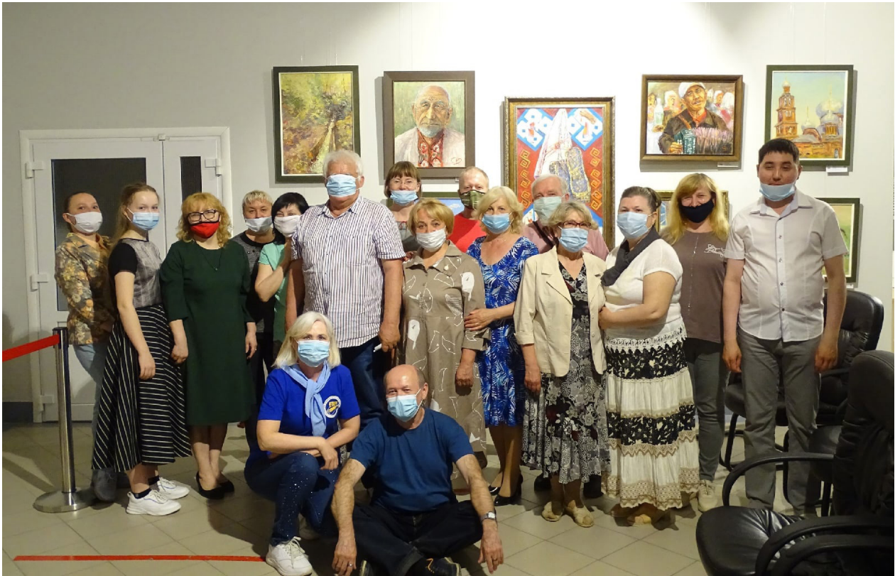
Участники вечера «Поэтический звездопад в музейную ночь». Музей истории и археологии. 15 мая 2021 г.