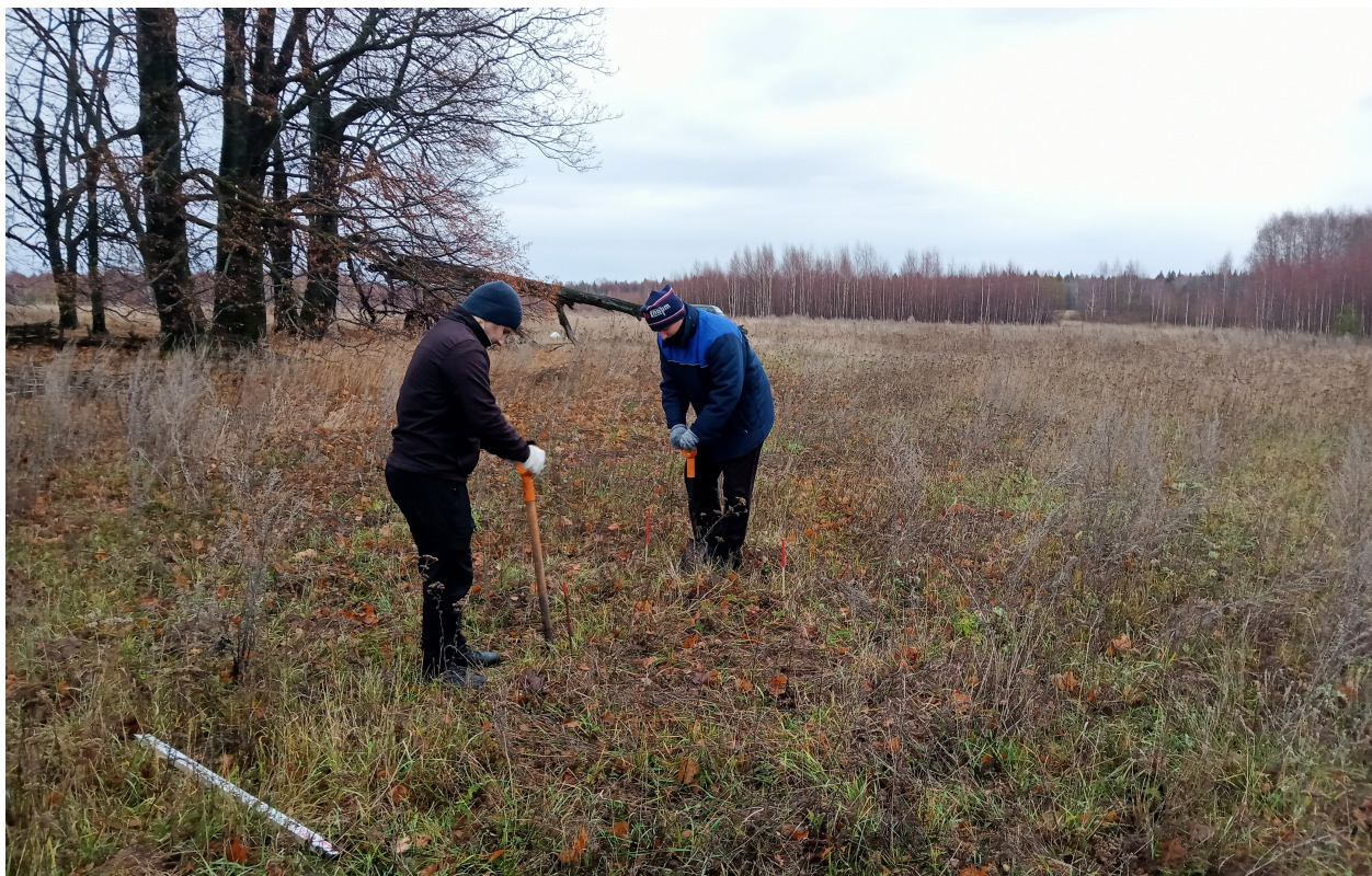
Работа по определению границ в Волжском районе на памятнике «Челюскинское мольбище»

В ноябре археологической экспедицией по заданию Министерства культуры, печати и по делам национальностей Республики Марий Эл проведены работы по определению границ 6 памятников археологии в Волжском и Моркинском районах республики.