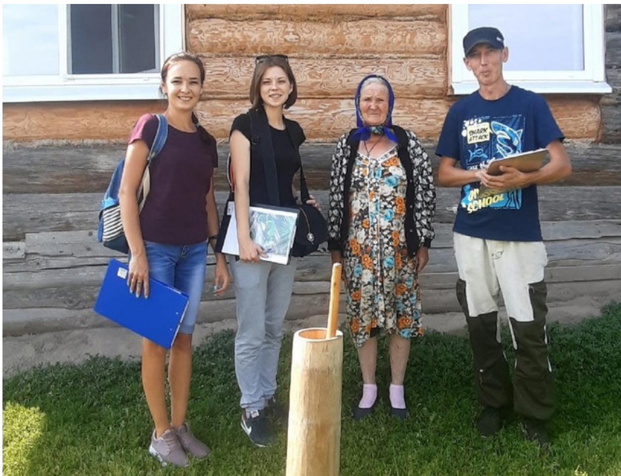
Участники комплексной этнографической экспедиции

ния экспедиции в пяти марийских деревнях (Фадейкино, Юрдур, Мари-Кужеры, Чодраял, Кутюк-Кинер), одной русской (Старое Мазиково), одной татарской (Кульбаш) Моркинского района собрано 38 предметов первой половины XX в. (предметы быта, внутреннего убранства дома и традиционного костюма шарпан-нашмакан мари). Опрошено 26 информантов различных возрастных категорий (от 1930 до 1960-х гг. р.). Записаны данные о локальных особенностях проведения свадебных, родильных и похоронно-поминальных обрядов и календарных праздников приволжской группы луговых мари, русского и татарского народов.